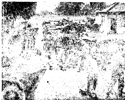
בלוב — ובבריטניה. תכונה בגודי שריון — מכונות השריון של "פרשי משמר הראש" בוינדור ו"צנטוריונים" בטריפולי.