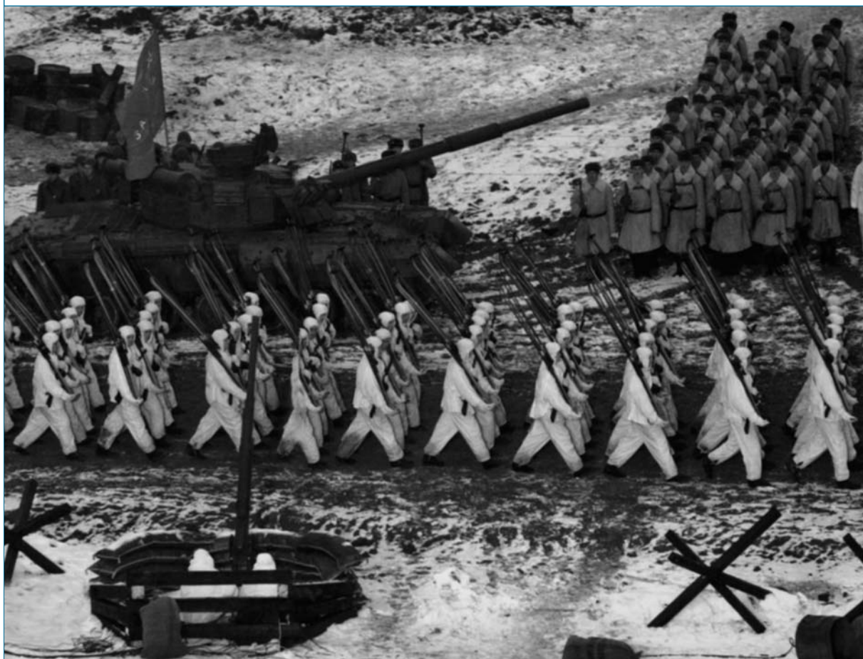
מלחמת המפרץ הראשונה ב־1991, שהתרחשה זמן קצר לאחר קריסת בריה"מ, פטרוניתה של דמשק, הציבה בפני סוריה תמרור אזהרה בולט בנוגע לצורך להעריך מחדש את תפיסת האיום על ביטחונה הלאומי