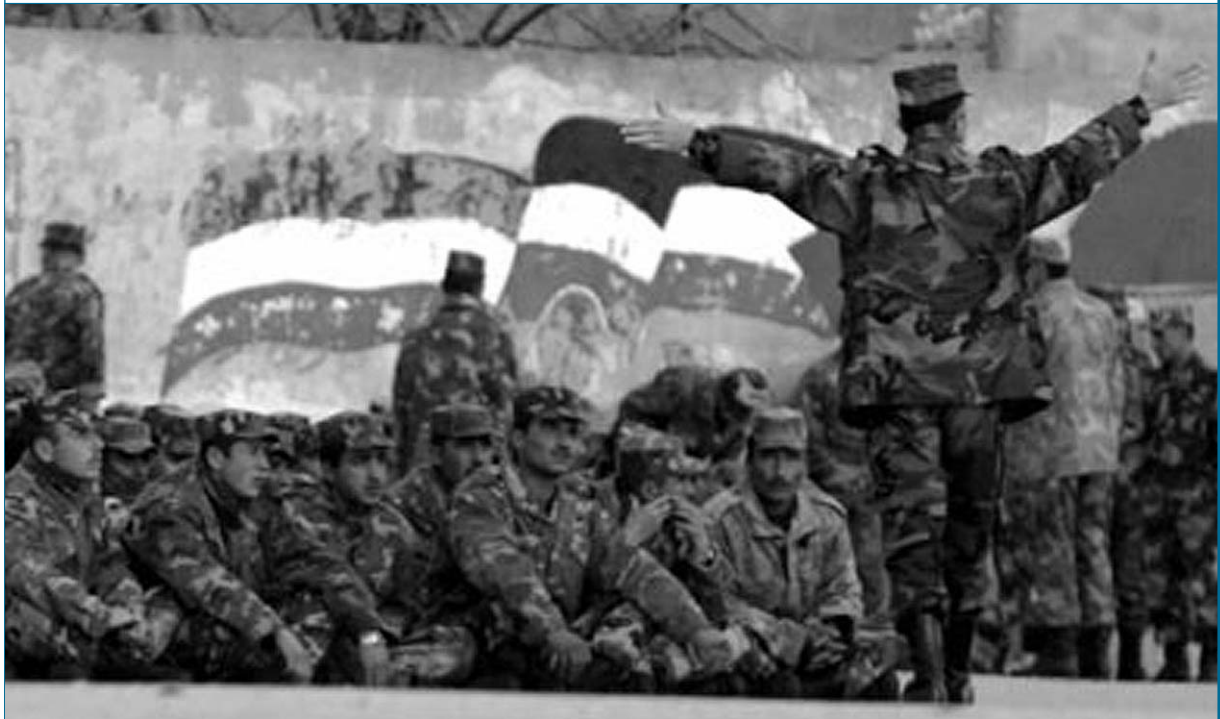
סיום הנוכחות הצבאית של סוריה בלבנון עורר מחדש דיון בנוגע לשאלות היסוד: מהם אינטרסי הליבה של סוריה נכון להיום?