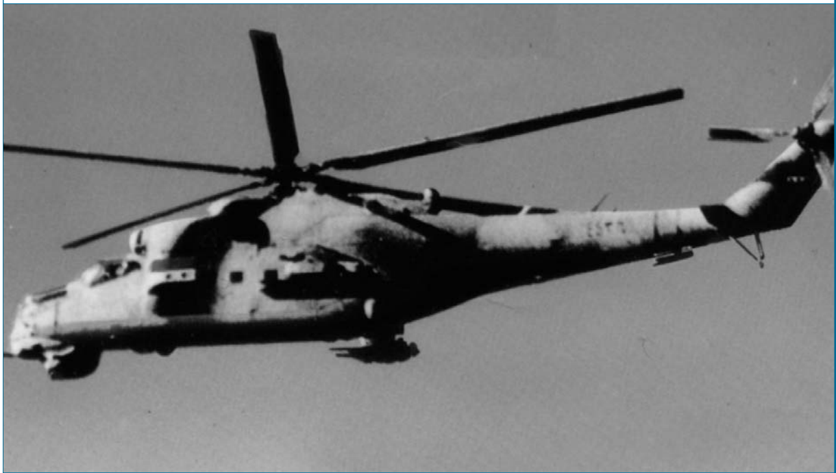
בעוד כל שכנותיה של סוריה מצטיידות בנשק מערבי חדיש, נותר צבא סוריה חמוש באמצעי לחימה מיושנים משנות ה-70 וה-80 של המאה הקודמת