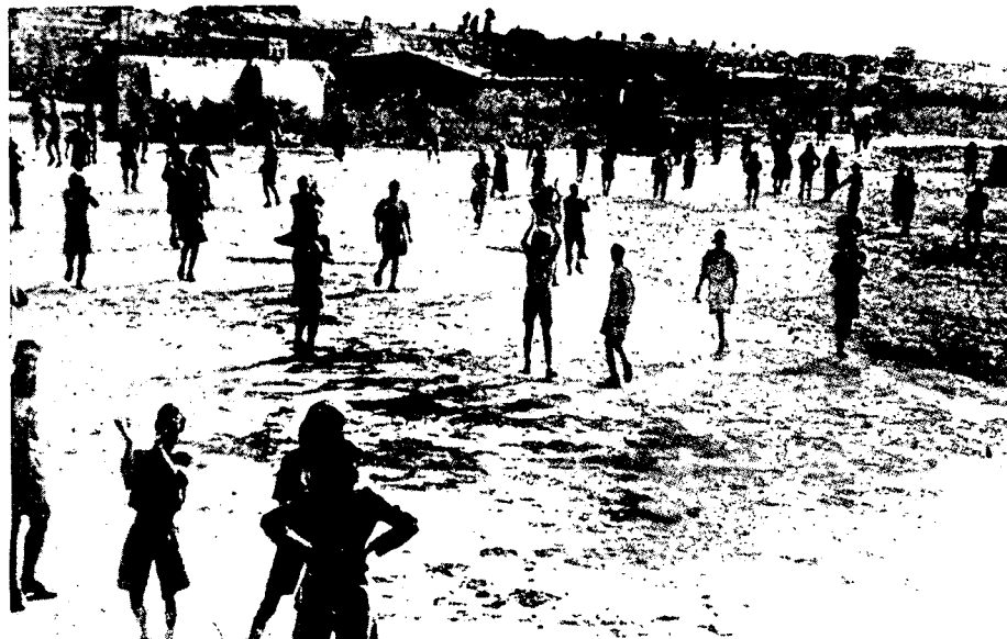
חיילים עיראקים כשדה התעופה במוסול בעת הגעת המטוסים הגרמנים