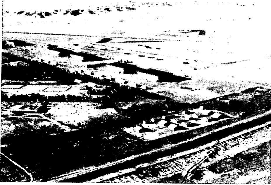
תצלום אוויר של חבניה