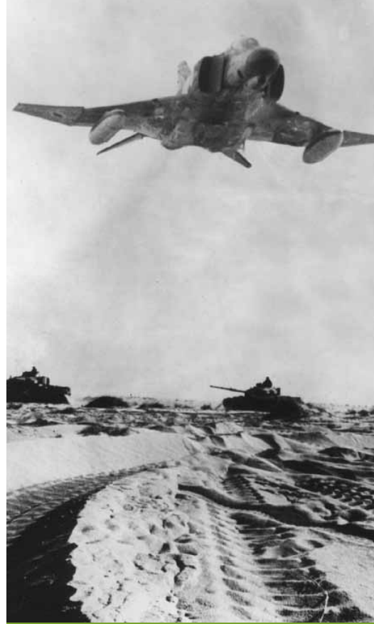
מטוס פנטום של חיל האוויר ביעף מעל טנקים של צה"ל במלחמת יום הכיפורים

המתכננים הסובייטים והערבים הפנימו את לקחי מלחמת ששת הימים ופנו לדוקטרינה חדשה שתנטרל את היכולות המעולות של צה"ל בלוחמת תמרון. על סמך הדוקטרינה החדשה נמנעו הערבים - ככל האפשר - מלהתמודד באוויר עם היתרונות היחסיים של חיל האוויר הישראלי והתבססו על בניית זרוע חזקה של הגנה