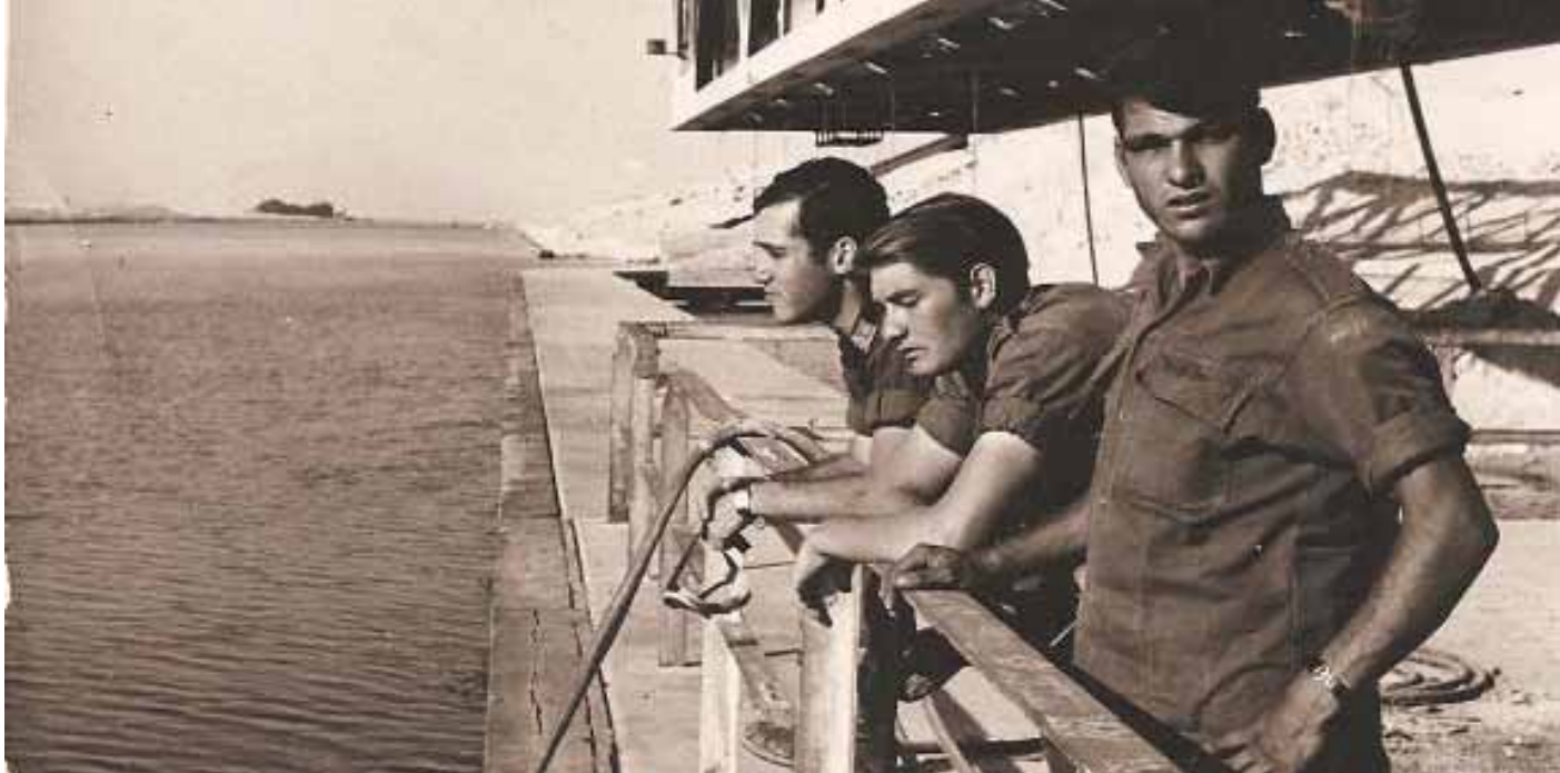
גשר פירדאן, תעלת סואץ, 1969 | התגובה הדיאלקטית של הסובייטים ושל הערבים במלחמת ההתשה הייתה לאמץ דוקטרינה הגנתית שכמוה הופעלה בהצלחה בשמי צפון־וייטנאם בשנים 1965-1968 לנטרול תמרון יבשתי הנשען על עוצמה אווירית

העת בנוגע לתועלת שניתן היה להפיק מתקיפת ההגנה האווירית המצרית (תוכנית "תגר 4") עוד לפני שהערבים פתחו במתקפתם. ישנם מי שסוברים שהפעלתה של תוכנית "תגר 4" כמתוכנן הייתה משתקת את ההגנה האווירית המצרית, ואילו האחרים גורסים שמלכתחילה לא היה בכוחה של התוכנית לאפשר חופש לחיל האוויר להשתתף בקרב היבשה בסיני. טענה נוספת שמשמיעים ותיקי החיל היא שהפעלת חיל האוויר - אחרי שלא ניתן אישור להוציא לפועל את מתקפת המנע האווירית - הייתה שגויה. כך או כך, על אף גבורת טייסי הקרב נותרה התחושה שההגנה האווירית של מצרים ושל סוריה כופפה במלחמת יום הכיפורים את כנפי חיל האוויר.