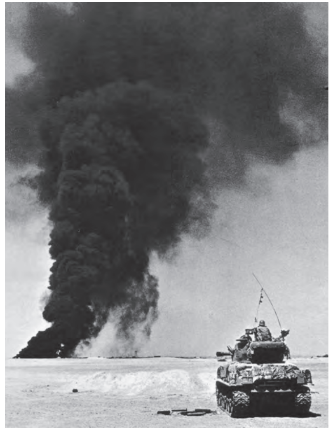
סנק שרמן בפעילות במדבר, 1967. דומיננטיות התמרון היא האמצעי העיקרי לביצוע משימה או להשגת ההכרעה

על-פי תורת המבצעים 2007 6 , גישת התמרון עניינה ניצול נקודות התורפה המתמשכות או הקבועות אצל האויב אשר פגיעה בהן צפויה להביא להכרעת האויב. 7 מכוחותינו נדרש לזהותן או ליצור אותן, וביחס אליהן לבנות את התוכניות להפעלת הכוח או את התוכניות לבניין העוצמה הצבאית הנחוצה לניצולן. לפי גישה זו דומיננטיות התמרון היא האמצעי העיקרי לביצוע משימה או להשגת ההכרעה, והיא במהותה התפיסה התחבולנית. כאמור, הרעיון בהפעלת כוח שכזו מרגיש את נטילת היוזמה והפעלת לחץ רצוף שאין האויב יכול לעמוד בו בפרקי הזמן ובמקומות