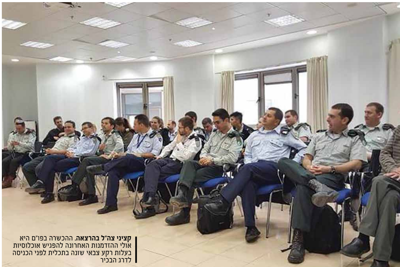
קציני צה"ל בהרצאה. ההכשרה בפו"ם היא אולי ההזדמנות האחרונה להפגיש אוכלוסיות בעלות רקע צבאי שונה בתכלית לפני הכניסה לדרג הבכיר

שתי זרועות או יותר. התפישה מאופיינת בהדדיות הפעולה, שעניינה מיוזג והיתוך היכולות הזרועיות בשלטנות [בדומיננטיות] משתנה תוך מימוש הפעולה הרב ממדית וביצועה הברזמני לכל עומק ורוחב מרחב הלחימה". 9