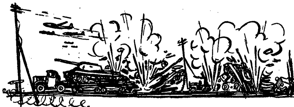
„לפגוע בשריון המתקיף בעת תנועתו לזירת הקרב“

(3) האפשרות השלישית לפגוע בשריון המתקיף היא בשעה שהוא נמצא בשטח-הכינוס או בשטח- ההיערכות. שטחים אלה מתאימים ונוחים להפצצה על-ידי אוירונים, ולפשיטות יחידות חיל-רגלים, ביחוד בלילה. שכן שטחי כינוס והיערכות, ו- אפילו יהיה איבטוחם מעולה ביותר, הם מטבעם „רכים“ הרבה יותר מאשר איזה מערך הגנה שהוא, וזאת כיון שכל כוח מרגיש שהשהייה בכינוס, ולא כל