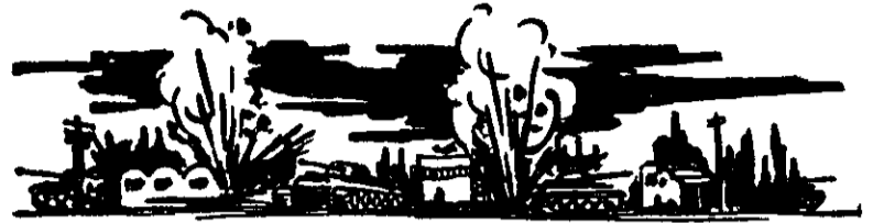
„פגיעה במתקני תחזוקתו של השריון התוקף“

שלבי הלחימה ואורח-הלחימה נגד שריון א. את הלחימה הנגד-טנקית ניתן לחלק לשניים: (1) פגיעה במתקני תחזוקתו ובסיסיו של שריון התוקף. (2) פגיעה בשריון עצמו.