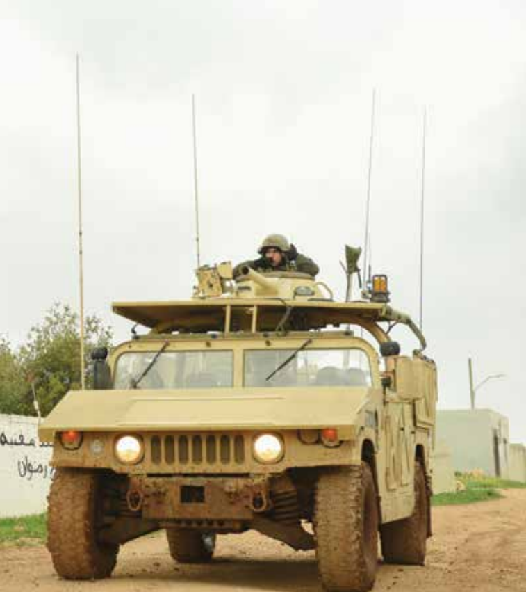
מלחמת לבנון השנייה חשפה שורה של ליקויים במערך המילואים, שהדגישו את חוסר

העם במילואים מלהתקיים בפועל, וגם מוכנותו של זה הייתה נמוכה מן הדרוש.