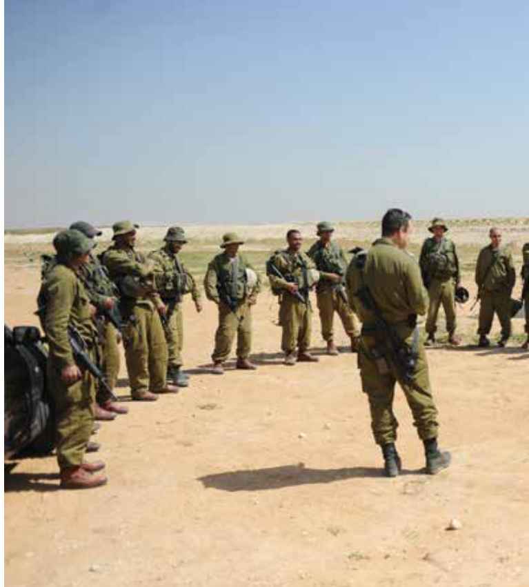
היבשה.

לקחי מלחמת יום הכיפורים ומלחמת לבנון הראשונה הבלטו את הליקויים שהתגלו בלחימת כוחות היבשה, ויחד איתם את הצורך הדוחק בהקמת גוף שישפר את השילוב בין החילות באופן מהותי. זו הייתה המטרה העיקרית בהקמתה של מפח"ש (מפקדת כוחות השרה) ב־1983, שהייתה בראשית דרכה בבחינת פשרה 10 שנכפתה על צה"ל על־ידי שר הביטחון משה ארנס. המפקדה קיבלה סמכויות מצומצמות שהתמקדו בעיקר בתחום התורה והאימונים. בהמשך, הייתה זו כבר המפקדה הכללית שהעבירה מסמכויותיה בתחום בניין הכוח – מתוך רצון לחזק את כוחות היבשה. בתחילה באמצעות הקמתה של מפקדת הזרוע לבניין הכוח ביבשה (1999), שהפכה לזרוע היבשה (2007), ובהמשך באמצעות מיזוגה עם אגף הטכנולוגיה והלוגיסטיקה (2016). הרצון ליצור "שלם יבשתי" ולתת עצמאות תפקודית לזרוע היבשה, בדומה לזרועות האחרות, נועד כדי לשחרר את המפקדה הכללית מהעיסוק ביבשה, ולאפשר לה להתמקד בתפקידיה העל־זרועיים. תהליכים אלו הובילו לכך שבד בבד עם חיווקה של מפקדת הזרוע היבשית, שבקבוצותיהם הועברו סמכויות רבות מהמפקדה הכללית לזרוע היבשה, הלכה ופחתה מעורבותה של זו, ובהמשך הצטמצמה