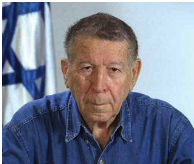
אלוף ישראל טל , מסקנתו של טל כבר לפני עשרים שנים היתה כי במציאות זו לא ניתן יהיה להמשיך להישען על חיל האוויר ככוח הרתעה בלעדי.

על־מנת לגבש תפיסה שתעצב ותכווין את התמרון היבשתי, צריכה להיות עבודה משותפת של המפקדה הכללית ושל זרוע היבשה. התפיסה היא מעין טלסקופ עם שלושה מפרקים: