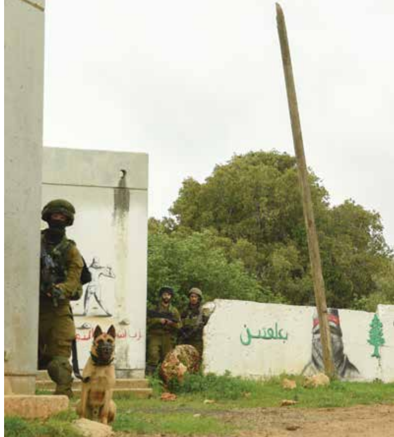
ההלימה בין המודל הקיים ובין הצרכים.

כניסיון להתאים את החליפה מהבר מצווה לחתונה. הרבה טלאים, מאמץ סיופי ותוצאה שרחוקה מלהשביע רצון.