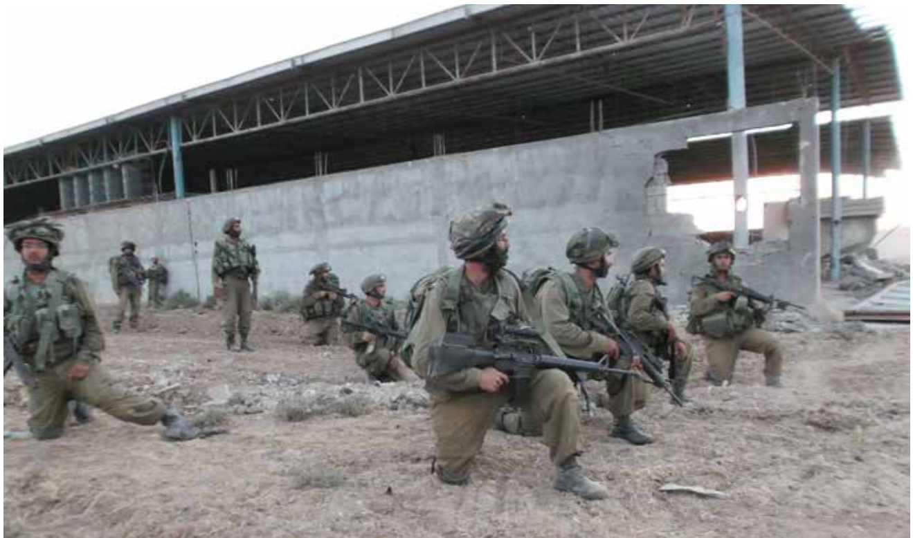
לוחמים בבית חנון, במהלך מבצע "צוק איתן". לתחושה שלפיה המקצועיות והאכפתיות של המפקד הן מאושיית הפיקוד, יש יסודות אבולוציוניים

ביטוי בנכונות המושפעים להקריב מעצמם בעקבות הדוגמה של המנהיג, ועבור הקבוצה שאיתה הם מזוהים.