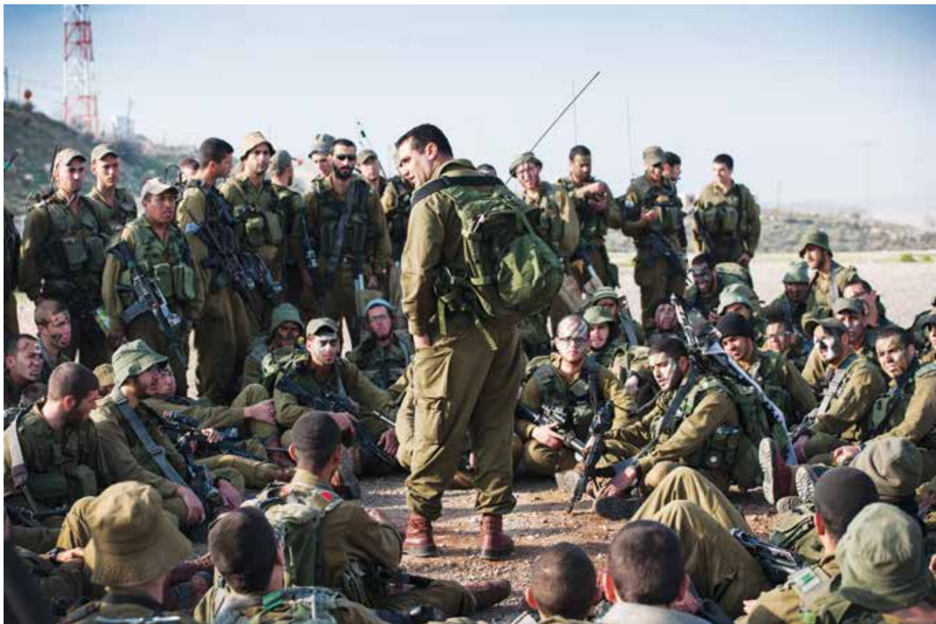
מפקד מול לוחמים בתדרוך. מפקד מעצים את מנהיגותו כאשר הוא מקבל על עצמו משימות שיכול היה לכאורה להימנע מהן בתוקף מעמדו

למשל, מפקד מעצים את מנהיגותו ומגדיל את אמינותו בעיני אנשיו כאשר הוא מקבל על עצמו משימות שיכול היה לכאורה להימנע מהן בתוקף מעמדו. ההיגיון האבולוציוני שביסודו של עקרון ההכבדה הזה הודגם לראשונה באמצעות המקרה של הטווס הזכר.