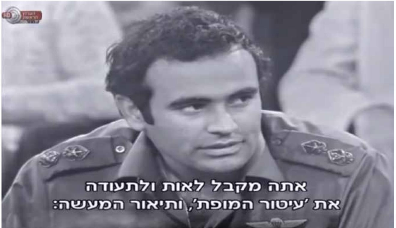
אביגדור קהלני. "השתמשתי בנשק האחרון שהיה ברשותי: בדוגמה אישית. או אז, הטנקים החלו לנוע אחריי"

או אכפתיות היא אות נוסף החייב להיחווה על-ידי מונהגים כדי שהם ייתנו מבטחם במנהיג. מדובר בתחושת הביטחון בכך שהמנהיג ידע לא רק להוביל אל המים - אלא גם יאפשר לשתות מהם.