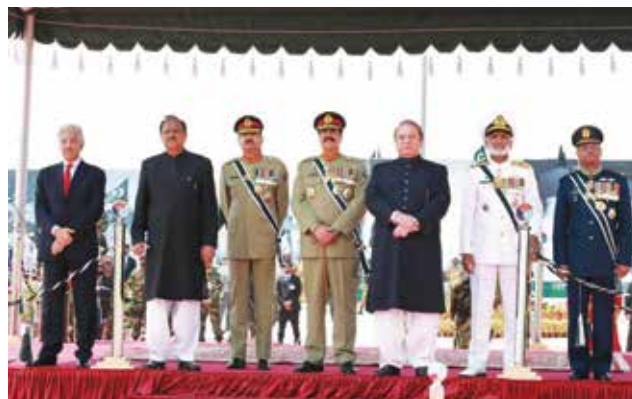
רמטכ"ל צבא היבשה עומד במרכז בימת הכבוד, במצעד הצבאי ביום הלאומי של פקיסטאן במרס 2015. לימינו עומד ראש הממשלה; נשיא פקיסטאן ניצב שני משמאל

לצבא היבשה כישורים ארגוניים וניסיון בניווט ענייני הביטחון הלאומי ומדיניותה הגרעינית של פקיסטאן, והוא הפגין שיקול דעת וכובד ראש בשימוש בהרתעה הגרעינית. גישתו הזהירה