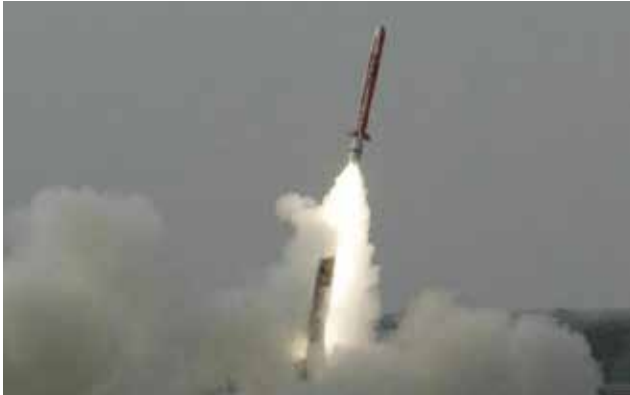
ניסוי שיגור בטיל שיוט גרעיני, אפריל 2018