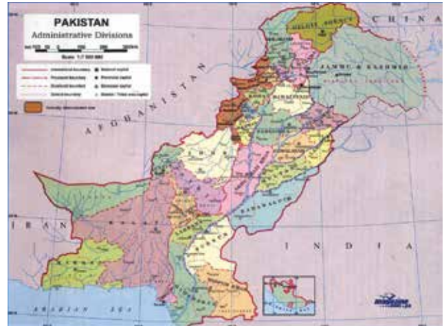
חלוקתה המנהלית של פקיסטאן ושכנותיה. מזה עשורים, צבא היבשה מתמודד עם סביבה אסטרטגית אלימה ועוינת, ועם עומס אתגרים ומשברים מבית

תת-היבשת, במהלכם נהרגו מאות אלפים ונמלטו מיליונים לאחת משתי המדינות. בתוך חודשים מעטים מקבלת העצמאות, נגררה פקיסטאן לסכסוך מתמשך עם הודו על עתיד חבל קשמיר, לאחר שפקיסטאן ניסתה להשתלט בכוח על החבל.