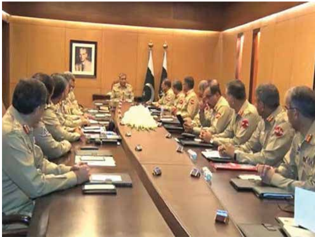
ישיבת פורום מטכ"ל של צבא היבשה, נובמבר 2017. מעגל ההשפעה הקרוב לרמטכ"ל יכריע לגבי הפעלת הנשק הגרעיני