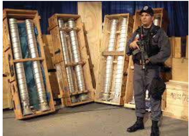
הצנטרופונות להעשרת אורניום שהועברו מפקיסטאן ללוב ואוחסנו בארצות הברית, בעקבות החלטת שליט לוב, מעמר קדאפי, לפרק את תוכנית הגרעין ב-2003. התפוצה הגרעינית מפקיסטאן שירתה את מטרותיו האסטרטגיות של הצבא

יחסו המבטל של הצבא כלפי ההנהגה האזרחית בא לידי ביטוי במספר רב של עימותים והשפלות של ראשי הממשלה, לרבות בשנים האחרונות. לדוגמה, ראש הממשלה שהיד ח'אן עבאסי, נכנע בנובמבר 2017 לאליומות מצד ארגוני אסלאם קיצוני, שהתעמתו עם המשטרה וחסמו במשך שבועות צירים מרכזיים בעיר הבירה, אסלאם-אבאד, וזאת לאחר שהצבא סירב לפעול. בכלל זה, הודח שר המשפטים, שוחררו המתפרעים שנעצרו ועל הממשלה הושת המימון של שיקום הנוקים. במקום לסייע לממשלה, "תיווך" הצבא