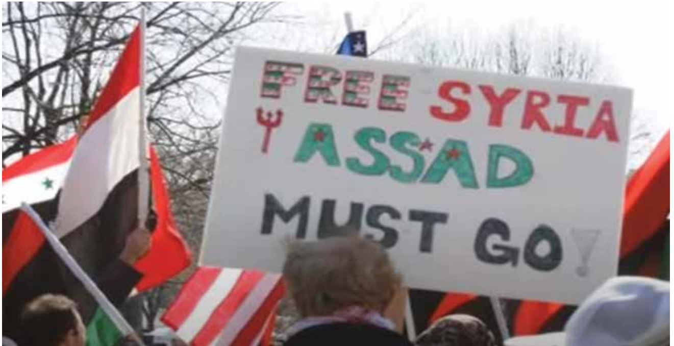
הפגנה נגד משטרו של אסד. ניסיונו של המשטר לדכא באלימות את המחאה הוא שהביא להידרדרות של סוריה אלי מלחמת אזרחים