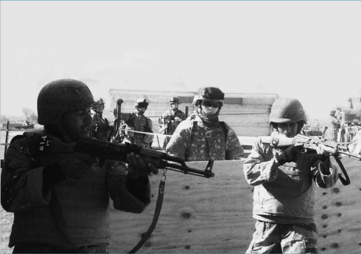
בשנים האחרונות לימדו האמריקנים את העולם כיצד לנהל מלחמה לא נגד מדינה, אלא נגד משטר

ותנצור את האש כשהיריב יחדל להילחם, ולו רגעית. קלאוזביץ טוען שבמצב כזה עלול היריב לנצח ולו בזכות יכולתו להאריך את משך העימות עד לנקודה שבה מחירו המצטבר אינו נסבל עוד מבחינתנו. 7