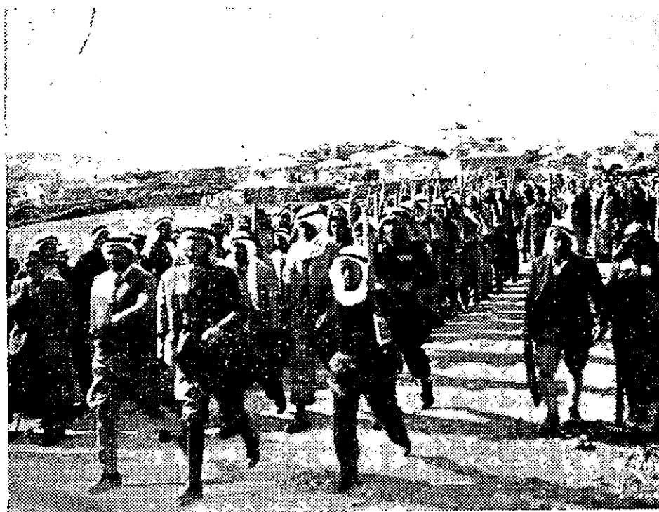
ה"גלם", ממנו הורכב המשמר-הלאומי הירדני

1. תושבי הכפרים — הפלחים, שטרם יצאו מהאווירה הפטריארכלית או הפיאודלית-למחצה, בה