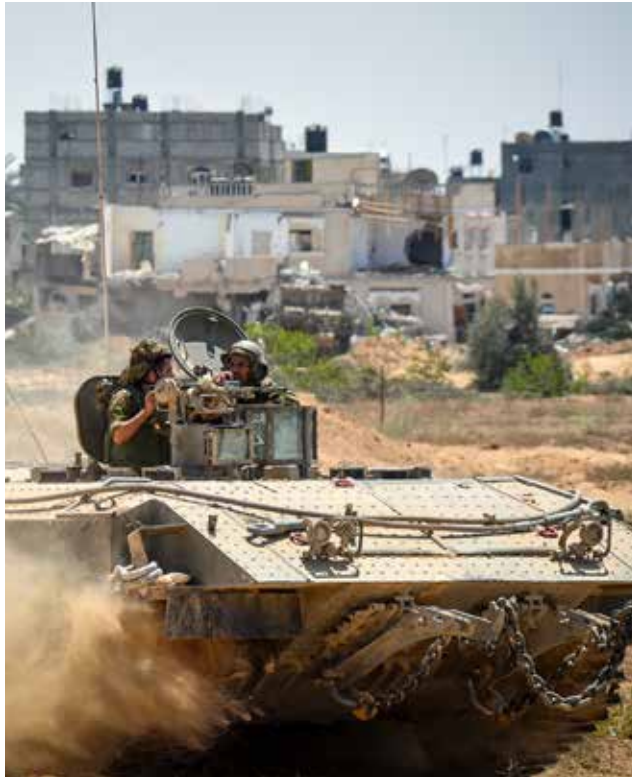
מבצע "צוק איתן". כיבוש רצועת עזה משמעותו הודאה בכישלון אסטרטגיית ההרתעה של ישראל מול חמאס

האינטרס הישראלי להימנע מעימות נרחב מול רצועת עזה בעתיד הקרוב מחד גיסא, והצורך להגיב על התקפנות של חמאס וארגוני הטרור ברצועת עזה, וליצור מציאות שקטה בדרום מאידך גיסא, ישראל פועלת אף היא במסגרת הלוחמה באזור האפור, כחלק מאסטרטגיית המב"מ.