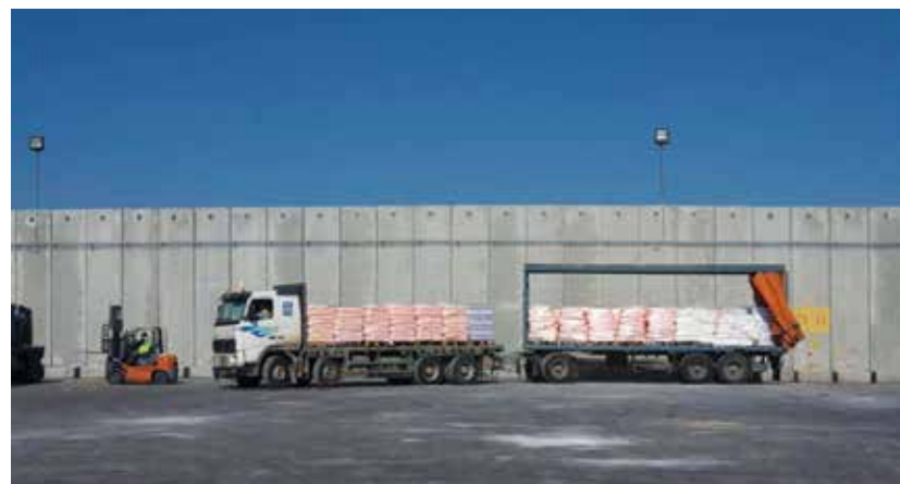
משאיות במעבר קרני. ישראל, באמצעות צה"ל ומשרד הביטחון, משתמשת בכלים לכלכליים ליצור מצב של "מקל וגזר"

חמאס עשתה שימוש גם באמצעים של הונאה על-ידי דיפלומטים, כאשר בכל סבב צבאי מוגבל שהתקיים בשנה האחרונה ניצלה את נוכחות המשלחת המצרית שנועדה לתווך הסכם רגיעה בין ישראל ובינה, על-מנת להפעיל לחץ על ישראל לסיים את הסבב הצבאי שהיא עצמה יזמה. 19 בכך מצליחה התנועה לקבוע סדר יום אסטרטגי. בפן התעמולתי הקפידו בחמאס לפרסם בתקשורת וברשתות החברתיות תמונות ערוכות היטב, המציגות בבזז את תקיפות חיל האוויר הישראלי, והשתמשו בתקשורת הישראלית כשופר להצעות משא ומתן להפסקת אש בכל סבב צבאי מוגבל שהתקיים בשנה האחרונה.