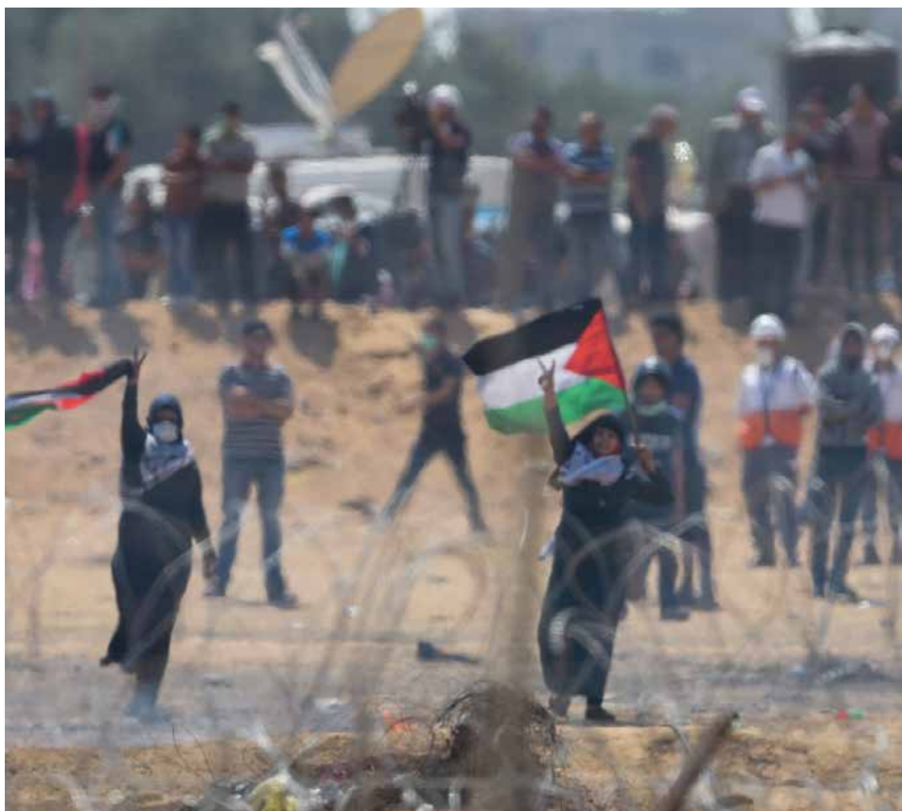
הפרות סדר ברצועת עזה. גישות "אזור אפור" אינן מוגבלות לשימוש של שחקנים מדינתיים בלבד

בשנה האחרונה פועלת תנועת חמאס נגד מדינת ישראל במסגרת הלוחמה באזור האפור. האפשרות הרצויה מבחינת ישראל היא להגיב באותה מדיניות. ואולם, אם מדיניות זו לא תצלח, עליה לנקוט אסטרטגיה המאזנת בין הפעלת תגובות עוצמתיות ובין הניסיון להימנע מהסלמה