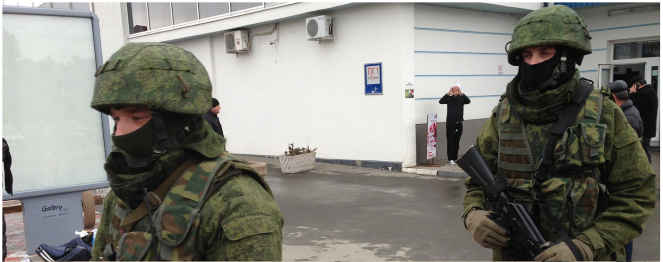
כוחות רוסיים באי קרים. העיסוק הגובר במחקר של הלוחמה באזור האפור התעצם בעיקר לאחר ההשתלטות של רוסיה על חצי האי קרים

נשמרה. בתקופה האחרונה חלה הסלמה משמעותית בגזרה, בשל החלטת חמאס לארגן ולהוביל הפגנות המוניות ואלימות בסמוך לגדר המערכת ברצועת עזה.