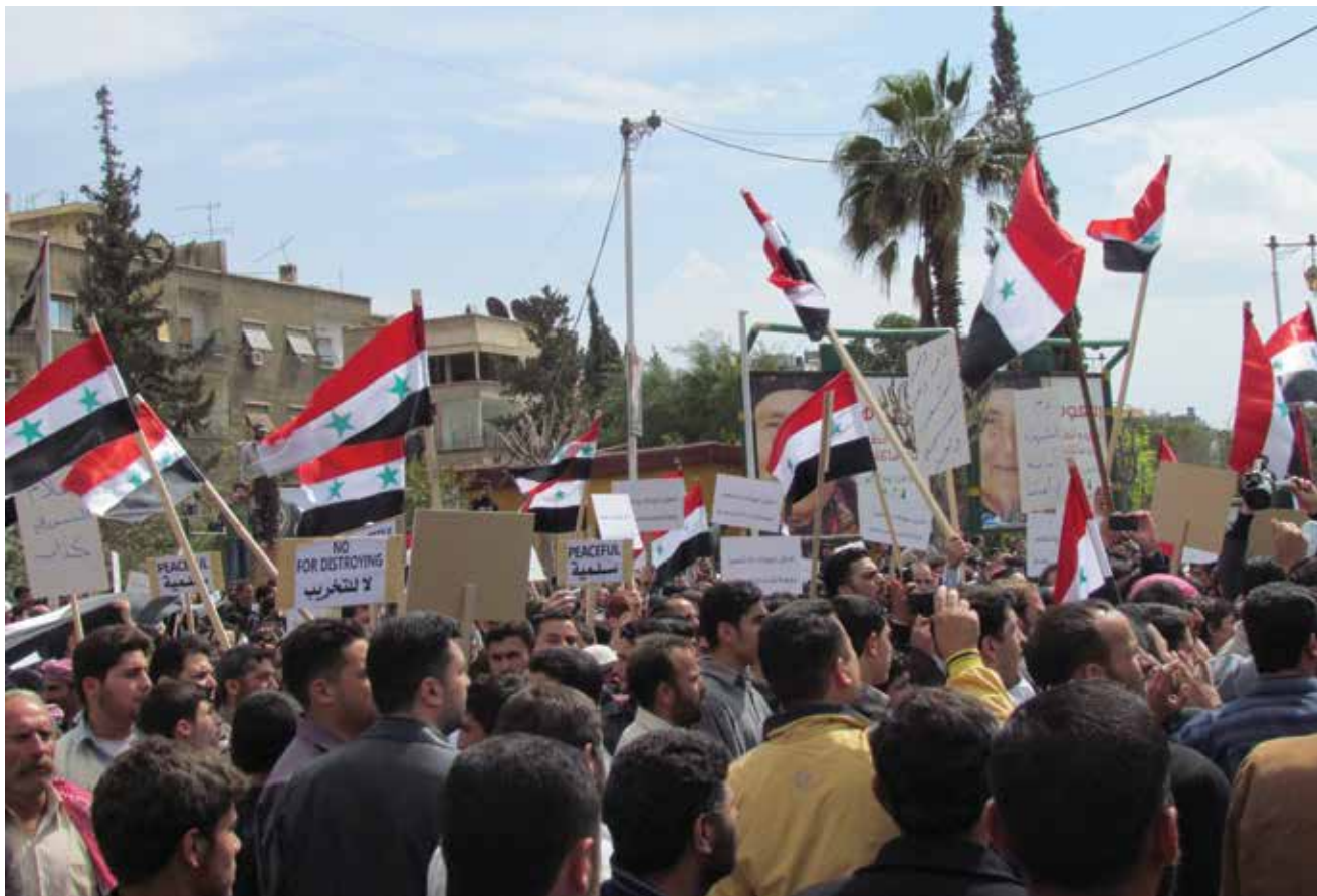
הפגנות בסוריה. "הצבא נצמד לשולי גלימתו של בשאר אל-אסד מתוך הבנה ברורה שאם הוא נופל - גם הצבא ישלם את המחיר"

או כל מדינה מזרח תיכונית אחרת תצטרך לשאול את עצמה לפשר השינוי, ולהתאים את האינטרסים שלה".