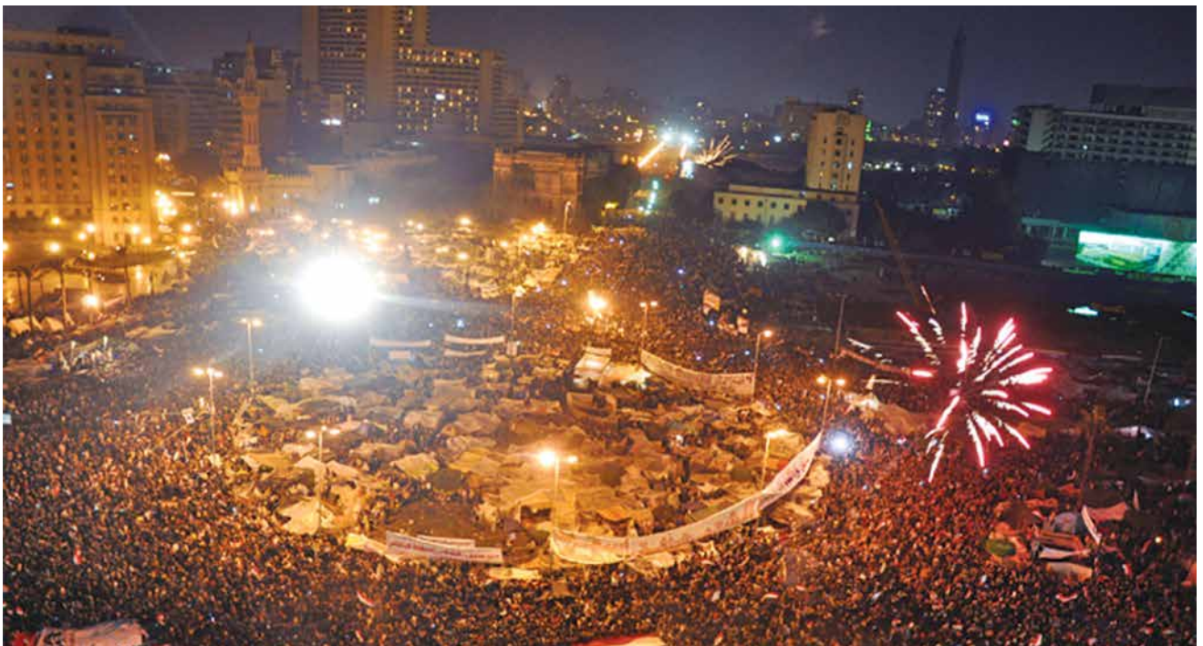
הפגנות בכיכר תחריק, מצרים. בניגוד למאה ה־20, ראינו בסופו של דבר ציבור שמדמיין את עצמו כשחקן פוליטי ויוצא לכיכרות"

הריאיון המצולם מופיע בערוץ היוטיוב של "מערכות" וזמין גם כמדוקאסט באתר צה"ל