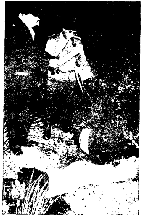
חיילי צה"ל שנהרגו ע"י פדאיון. רוב החיבורים פותחים את מלחמת 1956 במבצע "חץ שחור", שהיה תגובה לפעילות פדאיון

תיאר כיצד נסע יחד עם משה דיין, וחיילים מחא להם כף. להערותו של דיין, שהחיילים מוחאים כף לבן-גוריון, ענה ראש הממשלה: "מוחאים לקרב עזה". 14 ב"התייעצות חברים" העלה בן-גוריון על נס "את חשיבות גילוי עדיפותנו הצבאית על המדינה הערבית החזקה ביותר וכן את תועלתו החיובית של מעשה גמול זה, בנסכו רוח של ביטחון עצמי בצבא וביישוב". 15