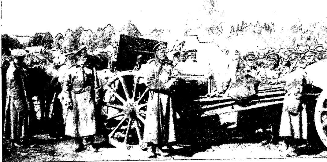
גדוד תותחים כבדים רוסי בראשית מלחמת העולם הראשונה

התפתחות הכרה ברורה בכישלונות מלחמת העולם הראשונה ובכשלי השיטה הצבאית הישנה לספק תשובות הולמות לבעיות, שיוצרת המלחמה המודרנית. הגורם השלישי היה התאגדות של קבוצת חיילים אינטלקטואלים צעירים בעלי מוטיווציה לשינוי. הגורם הרביעי היה הניסיון הדינמי וה"אחר" של מלחמת האזרחים, שהתממש באותה קבוצת קצינים. 13 אף שבעיות דומות העסיקו צבאות אחרים, לא השכיל