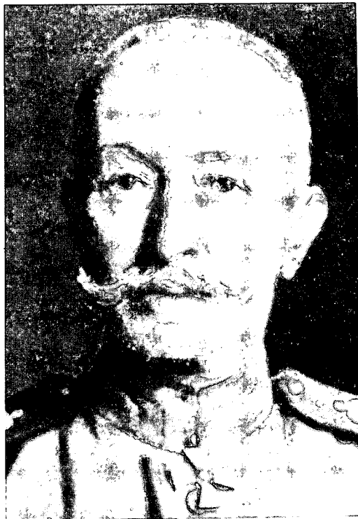
נגרל הפרשים אלכסיי ברוסילוב ניהל את המערכה המפורסמת ביולי 1915

רוב החוקרים מכירים את הניסיון הסובייטי במלחמת העולם השנייה, ומקבלים אותו כבסיס לתפיסה הצבאית הסובייטית המודרנית. אמנם, חלק ניכר מהתפיסה המודרנית בנוי על הניסיון במלחמת העולם השנייה. אולם הדברים מורכבים הרבה יותר ממה שנדמה למראית-עין. הזיקה בין התהליך, שאירע עד 1937, לאירועי מלחמת העולם השנייה מורכבת מאוד. השנתיים הראשונות במלחמת העולם התנהלו בנסיבות ובאילוצים, שלא עלו בקנה אחד עם ההיגיון של מה שנעשה קודם ושל הרצוי. לקראת סוף 1942 נערכה רוויזיה בכמה מהתפיסות המבצעיות. בעקבות התהליך הזה, שאיסרסון לקח בו חלק, נעשו רפורמות צבאיות, שבכמה מהן