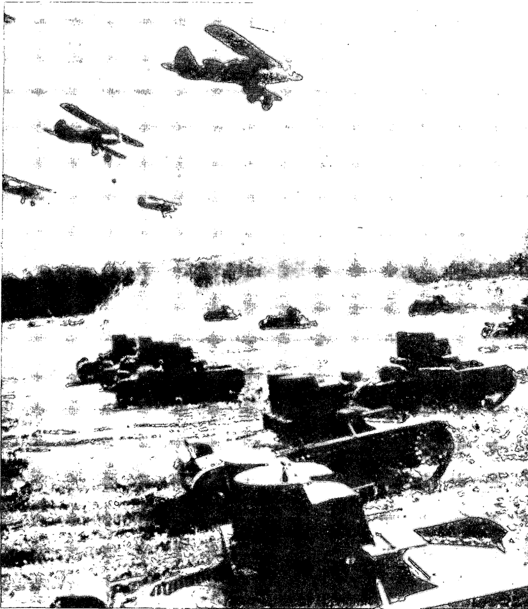
שיתוף פעולה אוויר-רקע בנוסח שנות השלושים בברית-המועצות