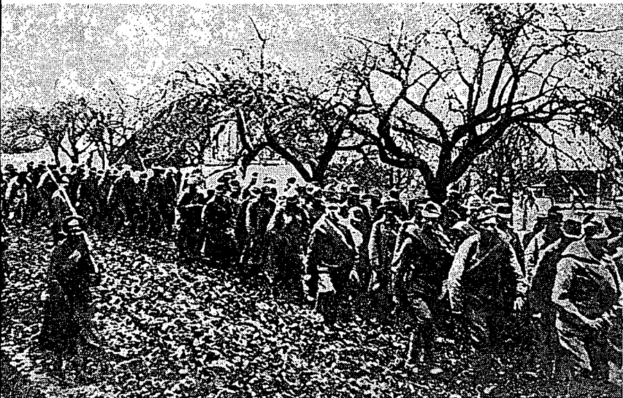
שבויים אוסטריים, שנפלו לידי הרוסים במתקפת ברוסילוב

שלמה, שגובשה בתהליך יצירתי, שיטתי והגיוני. אולם, דווקא המונח הגרמני "בליצקריג" נתפס כמייצג המובהק של התפיסה המודרנית של תמרון כוחות משוריינים.