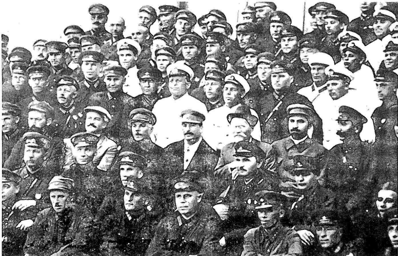
יוסף סטאלין עם נציגי הצבא בקונגרס השישה-עשר של המפלגה הקומוניסטית

מודרניים, המהדורה המתוקנת של ספרו של טוכצ'בסקי על טקטיקה ועל אימונים ותקנון השדה 1928. מייצגים מובהקים של הישגי השלב השני – ספרו של טוכצ'בסקי על שאלות חדשות על המלחמה, שנכתב בשנים 1931 – 1932, ולא שרד בשלמותו; 14 מאמר, של טוכצ'בסקי על תקנון השדה 1936 בגיליון מאי 1937 של "הכוכב האדום"; תקנון השדה 1936 (PU-36); ארמיית ההלם של וארפולומייב; קצבי מבצעים של גלאקטיונוב; בעיית הפריסה האסטרטגית של מליקוב; מבצעים בני-זמננו של זייגור; וספרו של איסרסון, התפתחות האמנות האופרטיביות משנת 1937. 15