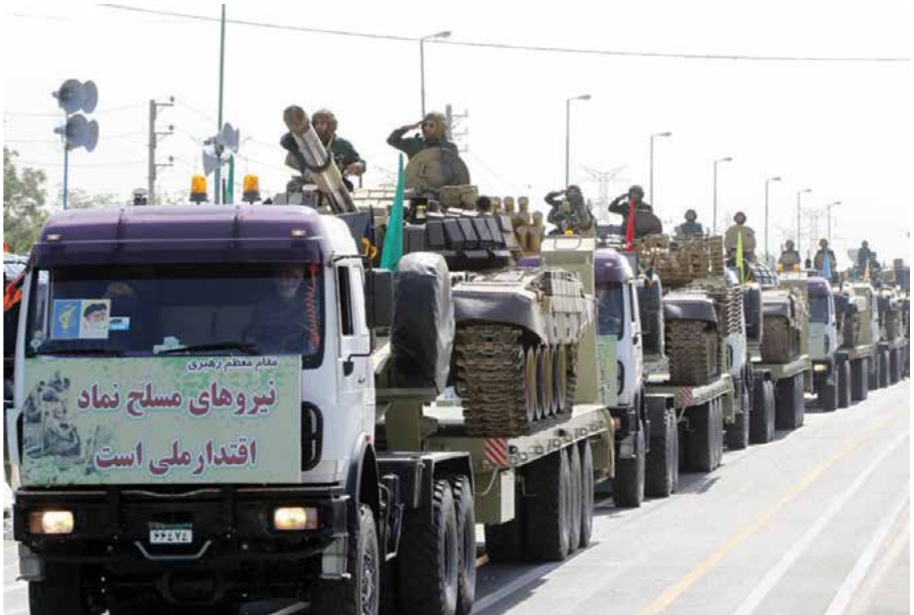
מצעד משמרות המהפכה באיראן. ברור שאיראן היא אויב של ישראל, אבל האם נגזר עלינו להילחם בה?

מגן. לקחו כמה שנים עד שדיכאנו את הטרור הפלסטיני, ואני מזכיר שאפילו למבצע הזה הגענו די בעמל, אחרי מאות הרוגים בעורף הישראלי.