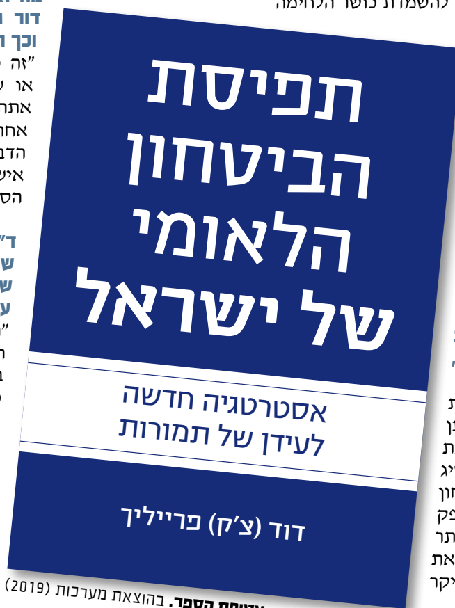
עטיפת הספר. בהוצאת מערכות (2019)

"המוסד הוא חלק ממערכת הביטחון הישראלית, ושותף לאותן משימות ולאותם יעדים שמערכת הביטחון הישראלית צריכה להשיג על-מנת להבטיח את הביטחון הלאומי של המדינה. אין ספק שצה"ל הוא הגורם החזק ביותר מבין שלל הגורמים שמרכיבים את המערכת הביטחונית, אליו בעיקר