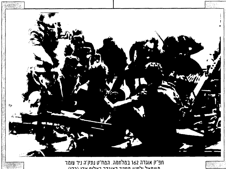
חפ"ק אוגדה 162 במלחמה. המח"ט נתק'ה ניד עומד משמאל ולפניו מפקד האוגדה האלוף אדן (ברן)

לשחוק את הצבא המצרי בקרב ההגנה הזו ככל האפשר ולצאת לקרב התקפה מערבה במגמה להכריע את הצבא המצרי. ההחלטה הזאת, שהתקבלה בפיקוד הדרום ובמטכ"ל, העידה יותר מכול על תחילתו של השינוי במצב המבצעי של צה"ל בסני באותם הימים. בין 8 ל-16 באוקטובר נערכו קרבות הגנה, שהתנהלו בעיקר