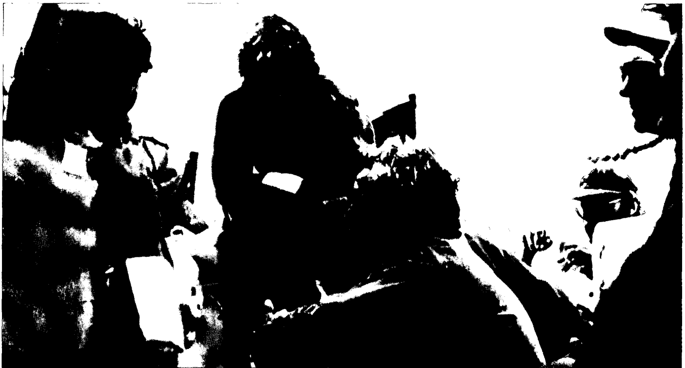
תדרין למפקדים: מימין יצחק בדיק, משמאל המח"ט נתקה ניר

נענו על הכביש בשדירה מבצעית - שני טנקים, זחל"ם החרמ"ש שלישי - ישירות לתוך מארב הקומנדו. המצרים לא ירו עדיין. לפתע שמעתי פיצוץ אדיר מאחורי! הסתובבתי לאחור בתא המפקד וראיתי שהזחל"ם נפגע מכמה פצצות אר-פי-ג'י שנורו עליו במקביל. מייד עם ירי הנ"ט על הזחל"ם, שהתפוצץ על כל יושביו, החלה אש תופת משני צידי הציר על הטנק שלי ועל הטנק השני. פקדתי באופן אוטומטי על נהג הטנק "נהג ימינה!" ועל כל הטנק "צוות חי"ר אש!" והטנק הסתער לעבר הדיונות מצפון לכביש; הטנק השני