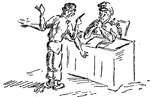
אין קטגור ואין סניגור — העברין הזריו יכול לצאת זכאי...

ונסף להגבלות, נעשים מאמצים מיוחדים להכשיר את קצין השיפוט לתפקידו במסגרת הקורסים, ומתנים עליה לדרגה של סרן (דרגת מרבית קציני השיפוט הזוטרים) במבחן בחוק, וכן מציינים את קצין השיפוט באמצעי-עזר (כגון "טבלת הדין המשמעתית") כדי לפקוח את עיניו ולהסיר מלפניו מכשול. ב. אין קטגור ואין סניגור — ומכאן שעלול העברין הזריו או ברהמזל לצאת זכאי, ואילו חברו הנקי מעוון עלול להענש, בגלל ליקוי שהקפדה על