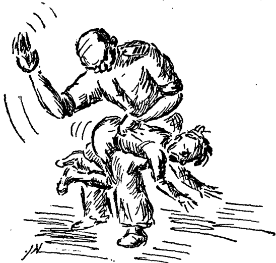
המפקד הוא "אבא של היחידה" דן את חייליו — "בניו"...

יתכן ואין הפרזה בכך, אם נאמר כי בדין המש- מעתי יש משום התגלמות "פטריוארכלית": המפקד, ה"אבא של היחידה" דן את חייליו — "בניו", "בני- שבטו" (*). הדין נסוב על דברים שנתרחשו "בתוך המשפחה" — וכל החיילים עוקבים בענין אחרי התגובה. ידוע להם מפי העדים שנוכחו במקום מה נעשה ונאמר בתדרו או אוהלו של המפקד — ושוקלים הם בפני עצמם או בצותא את צדקת הפסק