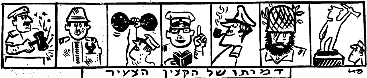
דמיותו של הקצין הצעיר

מה רוצים אנו למצוא בקצין צעיר המסיים בי"ס לקצינים ומקבל לידיו פיקוד על חיילים? עליו להיות החייל הטוב