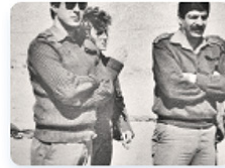
שיחות עם בוגרי היחידה