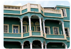
מיזם השבעים - חלק א'