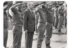
מפקדי היחידה בעבר