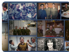
מיזם ראיונות מורשת - מפגש בין-דורי