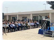
נאום הפרקליטה הצבאית הראשית בטקס חוננת הקריה המשפטית