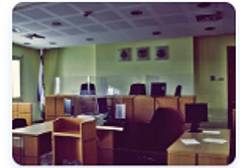
מיזם השבעים - מפגש בין דורי