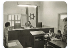
"סיפורו של מקום"