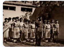
מיזם השבעים - חלק ב'