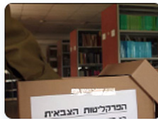
סרטון מורשת "דורות"