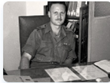
מיזם השבעים - מורשת שמגר