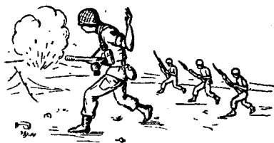
המ"מים הובילו בראש