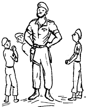
ערכים הנקנים בדרך של השראה

אתה טוען, בניגוד לדעתי, שחוסר הכשרה מתאימה זיא הגורם העיקרי לכך שהמ"כים נתגלו כחוליה וחלשה בשרשרת הפיקוד. לדעתך, השתלמויות נור-זפות עלולות לתקן ולהעלות בהרבה את רמתם של המ"כים. לא אכנס לויכוח, אומר רק זאת: כל תופעה נזה עפ"ר תוצאת מספר גורמים. חשוב לאתר את זמכריע שבגורמים. אין ספק שטענתך על ההכשרה זלוקה בחסר היא אחד הגורמים לתופעה. לדעתי