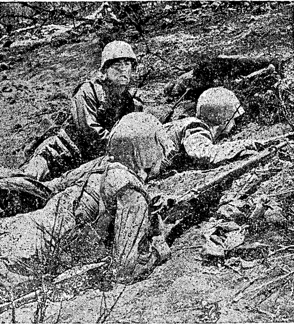
אור חזק מאיר לפתע את שדה הקרב, גורם לנפגעים רבים לאחד דקות מתנצלים אנשי הזרקאורים האמריקאיים על המשעשע...