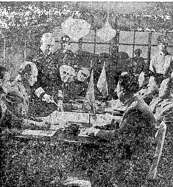
ומאחרי הקלעים: — אמריקאים במבחן נכונות להחזיק בגב חסרת-ערך על-אף ריבוי נפגעים. לסינים היו חיילים בשפש

ע"י הסינים ונהדמה בהסתערות: שמחת הפגישה משכיחה לרבע את סכנות הקרב והחיילים ומפקדם, המ.פ., מתקבר צים יתר על המידה כדי לחזק את השמחה. פנו שנופל בתוכם מעביר חלק מהם לעולם האמת, והשאר, משהת-נערו מן התדהמה, אינם מודים במשגה שבהצטופפות אלא תולים את הקולר בארטילריה האמריקאית שאינה מבחינה בינם לבין האויב. מרבייתם תומכים בתחזוק שבהם וברטינתו כי "לא יילחמו כאן כדי להיהרג משני הצדדים". המ.פ., שאשמתו אינה פחותה משל השאר, עומד לבדו מול גוש מלוכד של חייליו מרוטי העצבים ורק תודות לכושר מנהיגותו נחלץ ממצב קשה זה אשר עלול היה להביא לידי כשלון בביצוע משימת הפלוגה.