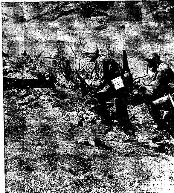
יד רב משרה המ.פ. בשמשו מופת לחייליו — בעיקר לאלה מוכי ההלם ואחוזי הפחד.

בקורות אלה זכאי הסרט לשבח מיוחד בהביאו בזה אחר זה מצבים ונתוני קרב מציאותיים ככל האפשר. יתכן שהישג זה, שיש בו בודאי מן הכונה ומן האופי של לימוד מקצועי, גורע במידת־מה מאותה הנאה שחשים אנו בסרט עלילתי מובהק. הפעם זוכים אנו להבלטת מירב התופעות השגורות בקרב הרגלים: בין השאר מודגשת למשל שאלת האמון במפקד בדוגמת אותה שאלה נצחית של חייל: „האם הוא יודע משהו, המפקד הזה?” ותשובת ידידו: „מכל מקום יודע מספיק כדי לקבור אותך כחוק” תרענן ותזכיר ודאי למפקדים רבים כי אמון חייליו מותנה ביכולתו להנהיגם ולהובילם נכונה בקרב. דוגמה מאלפת מומחשת לא פחות ברגע דרמטי בו נפגשים חיילי פלוגת קינג בחיילי יחידה סמוכה שנתקה