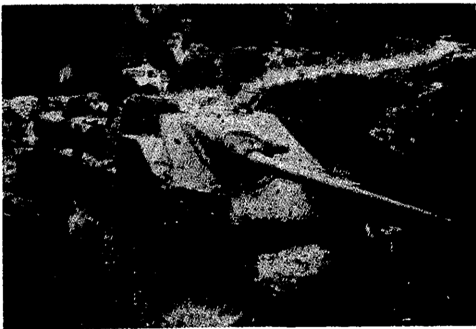
טנק מצרי שהוצא מכלל-פעולה על ידי לוחמי-גרילה מתומכי האימאם

לא תמיד לחמה מצרים בשצף-קצף — בכל אמצעי התעמולה העומדים לרשותה ועל-ידי הפעלת צבא סדיר — נגד משטר האימאם, ובמיוחד נגד אל-בדר אישית. ב-1958 היתה מצרים מוכנה להתאגד עם תימן ולהקים את „איגוד מדינות ערב“, שלא חרג מעולם מגדר הסכם שעל הנייר, אולם שימש כבלם לתרונות המצרית בתימן. אף לאחר שהתפרק ה„איגוד“ (בעק-בות פירוק קע"מ) וגברה ההסתה המצרית נגד האימאם, תוך תמיכה גלויה בחוגים התוססים שבתימן ומחוצה לה — לא