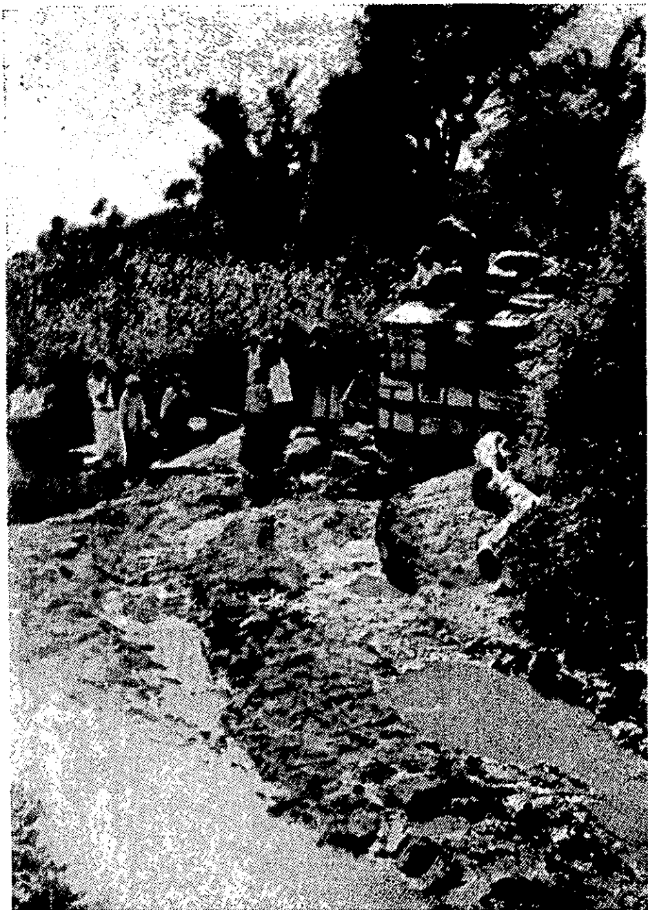
הדרך הראשית מתעו לעדן

תנאים אובייקטיביים אחדים משפיעים על אופי המערכה הצבאית המתנהלת עתה בתימן. פני-ההקרקע של השטחים ההרריים מבוטרים מאוד, לאורך ולרוחב, ואת מורדותיהם מציינים מצוקים תלולים וואדיות עמוקים. טיבו זה של השטח ההררי, האופיני לנוף התימני, ונחשלות שליטיה — גרמו למיעוט הדרכים בתימן ולהתהוות צירי-תנועה מוגדרים אשר רובם נשלטים בקלות מן ההרים, ביניהם הם עוברים. האוכלוסיה התימנית מורכבת, כאמור (בעיקר באזורים ההרריים), מבני שבטים עזי נפש, האוחזים בנשק מגיל צעיר, מכירים היטב את אזורי מגוריהם ורגילים לאקלים ההררי הקר. מאזן הכוחות נטה באופן טבעי לטובת הצבא המצרי — בגלל עצם היותו צבא סדיר, ההבדלים ברמת המשמעת, האימון והציוד של הלוחם הבודד, וכן כתוצאה מן המחסור, אצל כוחות ה-