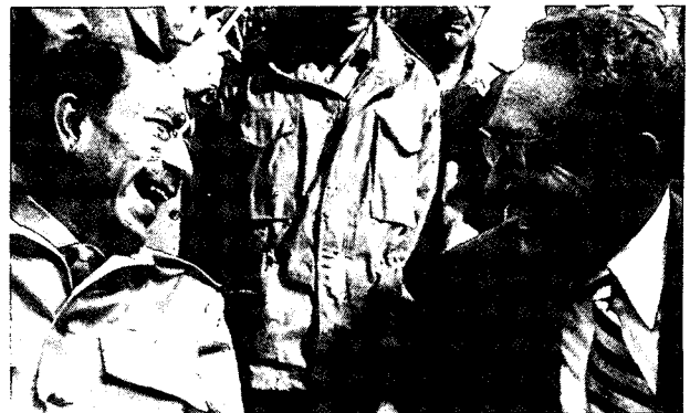
קיסניגר וסאדאת בשלהי מלחמת יום-הכיפורים

• בחינת יחסי ברה"מ עם מצרים, כפי שהתפתחו מאז סילק סאדאת את הנוכחות הצבאית-האסטרטגית הסובייטית ממצרים ביולי 1972, שוללת את הסבירות שהסובייטים הציבו