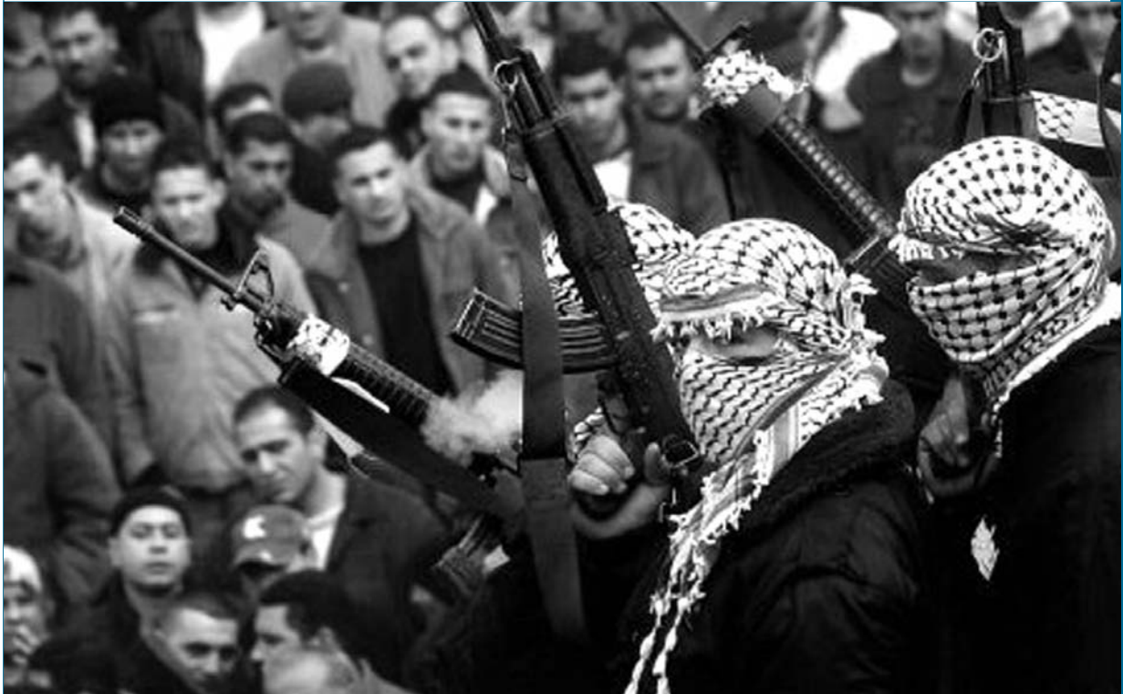
הצעדים נגד מערך הדעוה פגעו באוכלוסייה תמימה, שגורלה בין כך ובין כך לא שפר עליה, וחמור מכך: קיים חשש שהצעדים האלה אף חיזקו את כוחם של הגורמים הקיצוניים בשטחים, שכן הם העמיקו את תחושת הייאוש וחוסר התקווה

"האגודה האסלאמית" בחברון (אגודת חמאס דומיננטית שהוצאה בישראל אל מחוץ לחוק). חומרי הלימוד האלה כללו תמונות של מחבלים שנהרגו או שנעצרו ואשר עוטרו על-ידי תלמידי בית הספר וכן את צוואתו של מחבל מתאבד מהזרוע הצבאית של החמאס. 13