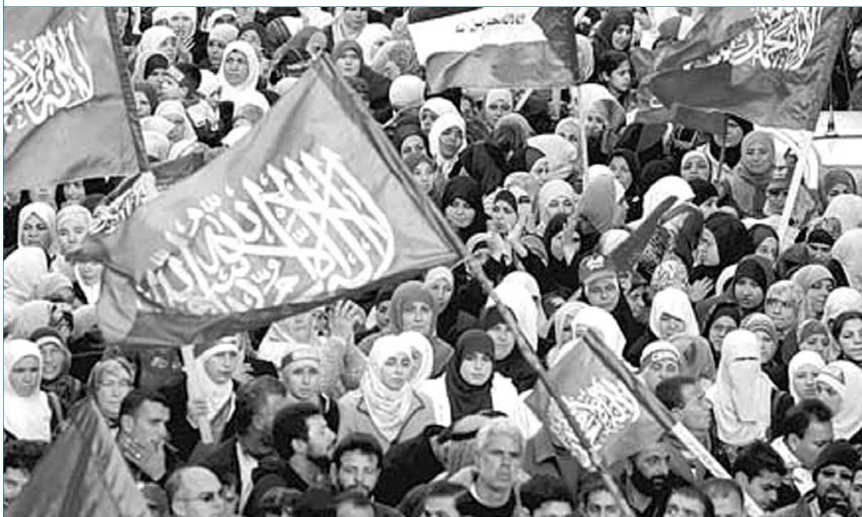
אף שמערך הדעוה הוא המערך ההומניטרי-אסלאמי הגדול ביותר בשטחים, הוא עדיין רחוק מלהיות הגורם ההומניטרי הדומיננטי בשטחים