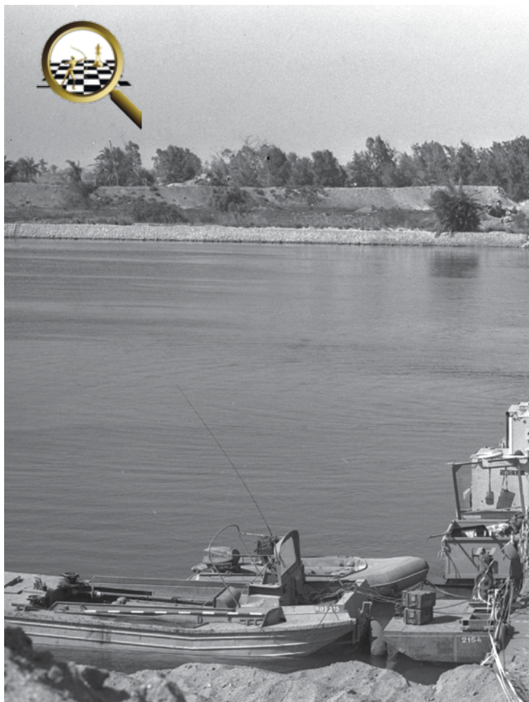
בתמרון כדי לשפר את יכולתו להשמיד ביעילות רבה יותר.

אחרי הריון ההגותי לגבי מהות התמרון הרבי-זרועי והאופן בו הוא משרת את המערכה והמלחמה, נדרש ריון של הֶקְשֶׁר הייחודי שבו תידרש ישראל לממש תמרון רבי-זרועי לפי המאפיינים הבאים: הזירות הצפויות, האויבים הצפויים, העימותים הצפויים וכוחותינו הצפויים. לבסוף, נדרשת כתיבת תורה המציגה את אופן הפעולה האידיאלי של כוחותינו אם יוחלט לבצע תמרון רבי-זרועי. ההערות למאמר זה מופיעות בסוף הגיליון.