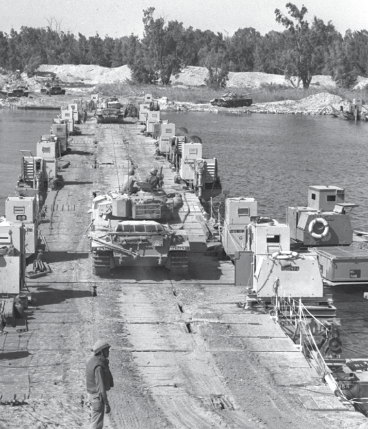
טנק חוצה את תעלת סואץ במלחמת יום הכיפורים. גם מי שדוגל בשחיקה משתמש

נדרש דיון בהקשר הייחודי שבו תידרש ישראל לממש תמרון רבי־זרועי, וכתובת תורה המציגה את אופן הפעולה האידיאלי של כוחותינו