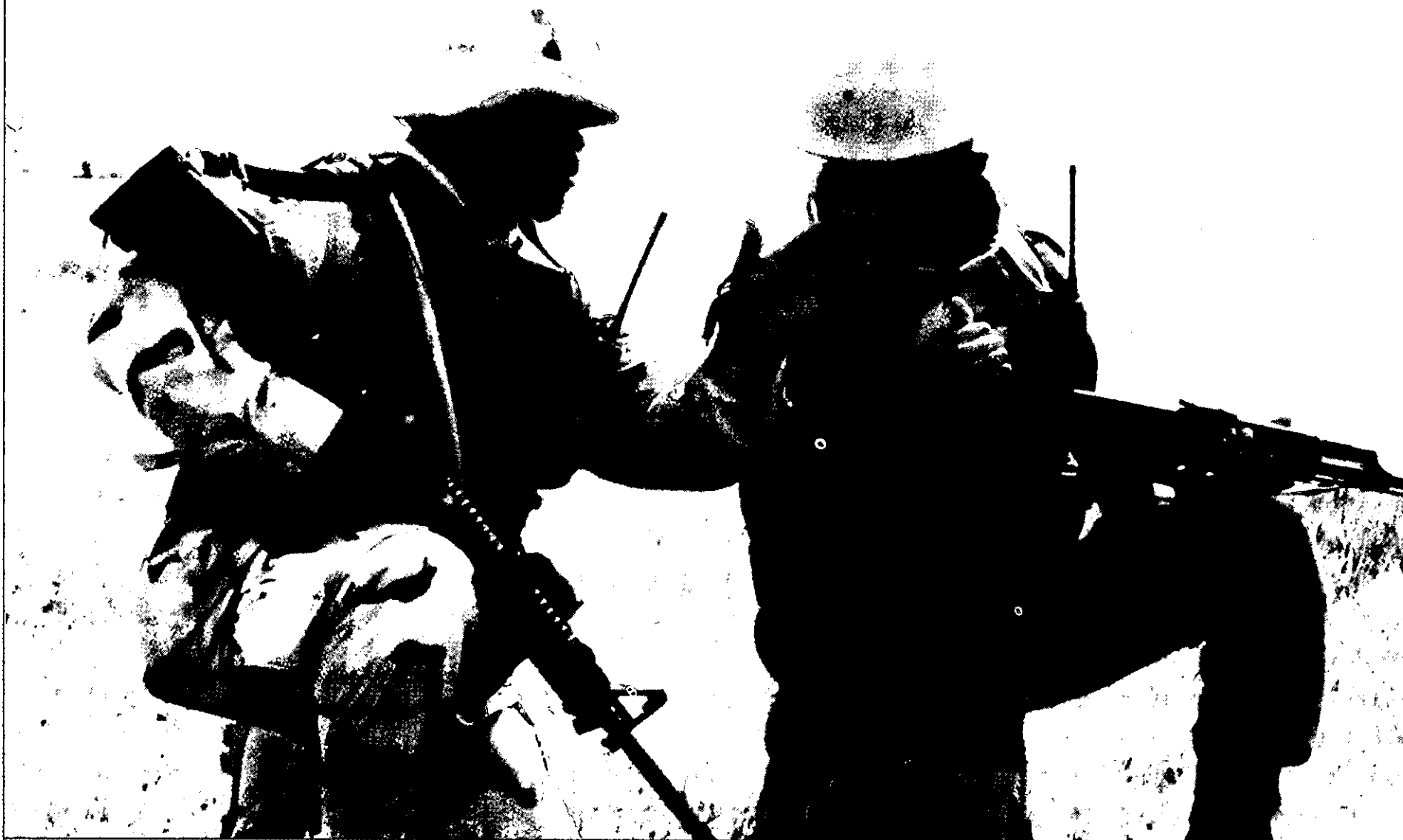
צה"ל אושש את טענתם של המפקדים האמריקנים כי הגורם האנושי הוא המפתח לניצחון

תחת פיקודו, החלו ללמד את לקחי מלחמת יום הכיפורים כבר בסוף 1974.