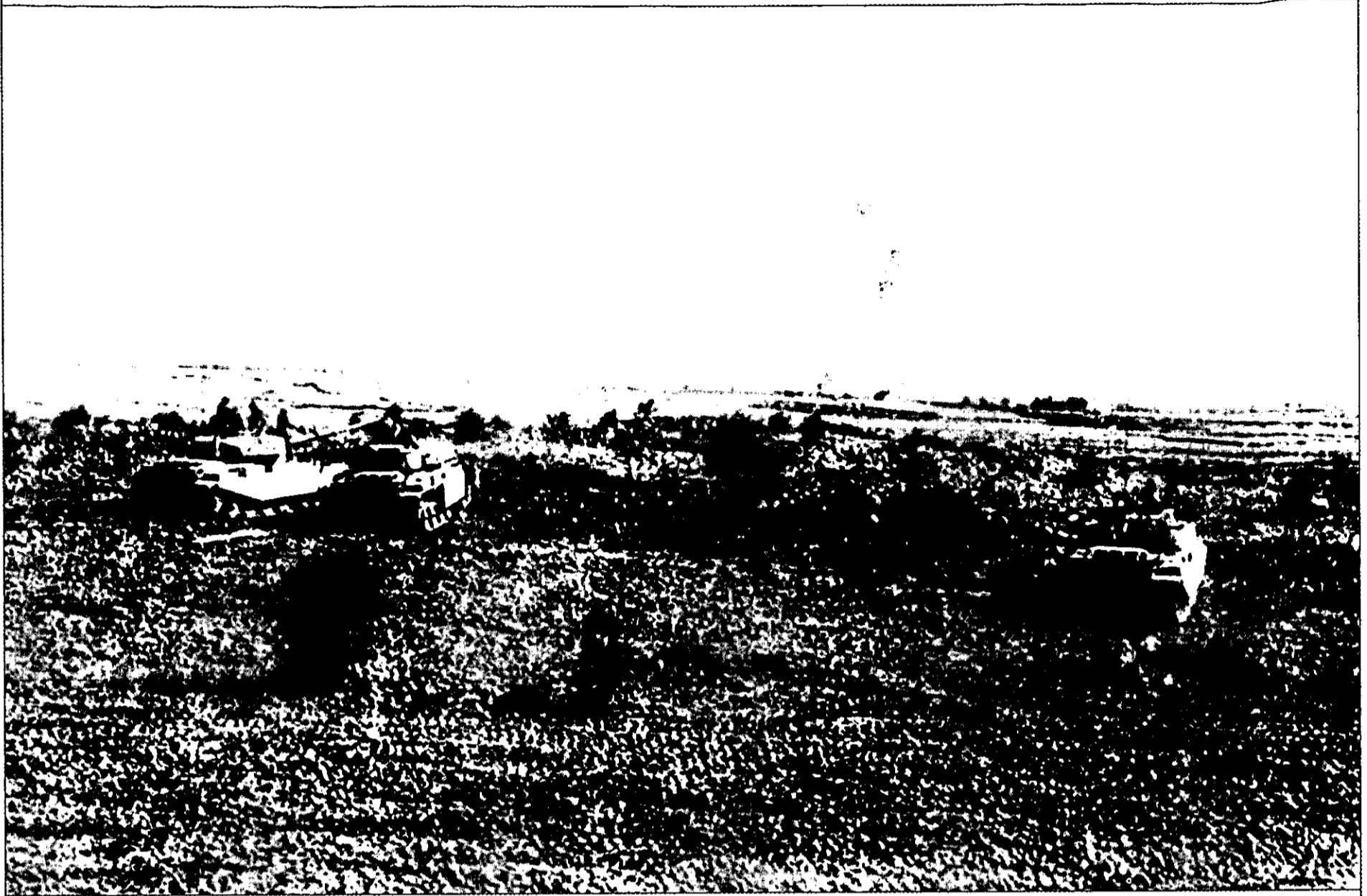
להתפעלות של דפוי מהמקצוענות של השריונרים בצה"ל היו השלכות חשובות על הרפורמה בהכשרה ובאימונים שביצעה TRADOC

בשנות ה-70, ואין זה המקום להרחיב ולפרט בעניין הזה. עם זאת חשוב להבין את ההקשר לעמדה של דפוי. הוא חשש שבגלל הקיצוצים בתקציב יידרש הצבא לבסס את דוקטרינת ההגנה שלו באירופה על טילי נ"ט זולים במקום להצטייד בטנקים יקרים. הוא הציג נתונים המצביעים על האפקטיביות הנמוכה של טילי הנ"ט כדי להדוף קריאות לצמצם את ההשקעות בטנקים מודרניים, שלדעתו היו הגורם המרכזי בקרב היבשה.