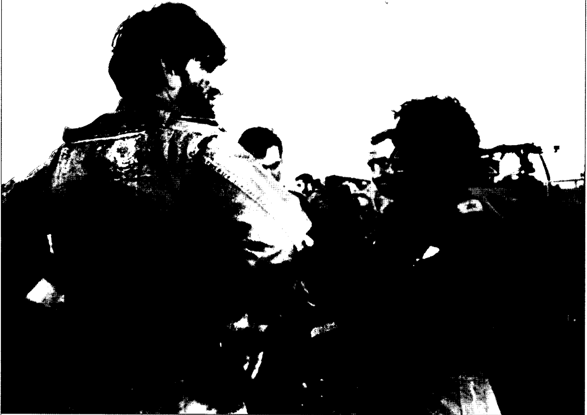
קרבת ההגנה שניהלו סגן-אלוף אביגדור קהלני וגדודו בימיה הראשונים של מלחמת יום הכיפורים הוא, למעשה, המודל שהציב דפוי לכוחות האמריקניים שהיו ערוכים בגרמניה כדי להגן על מערב אירופה

כלליים מאוד, ולא תמיד ניתן להבין מהם אם מדובר בהגנה או בהתקפה, בחזית צפון או בחזית הדרום.