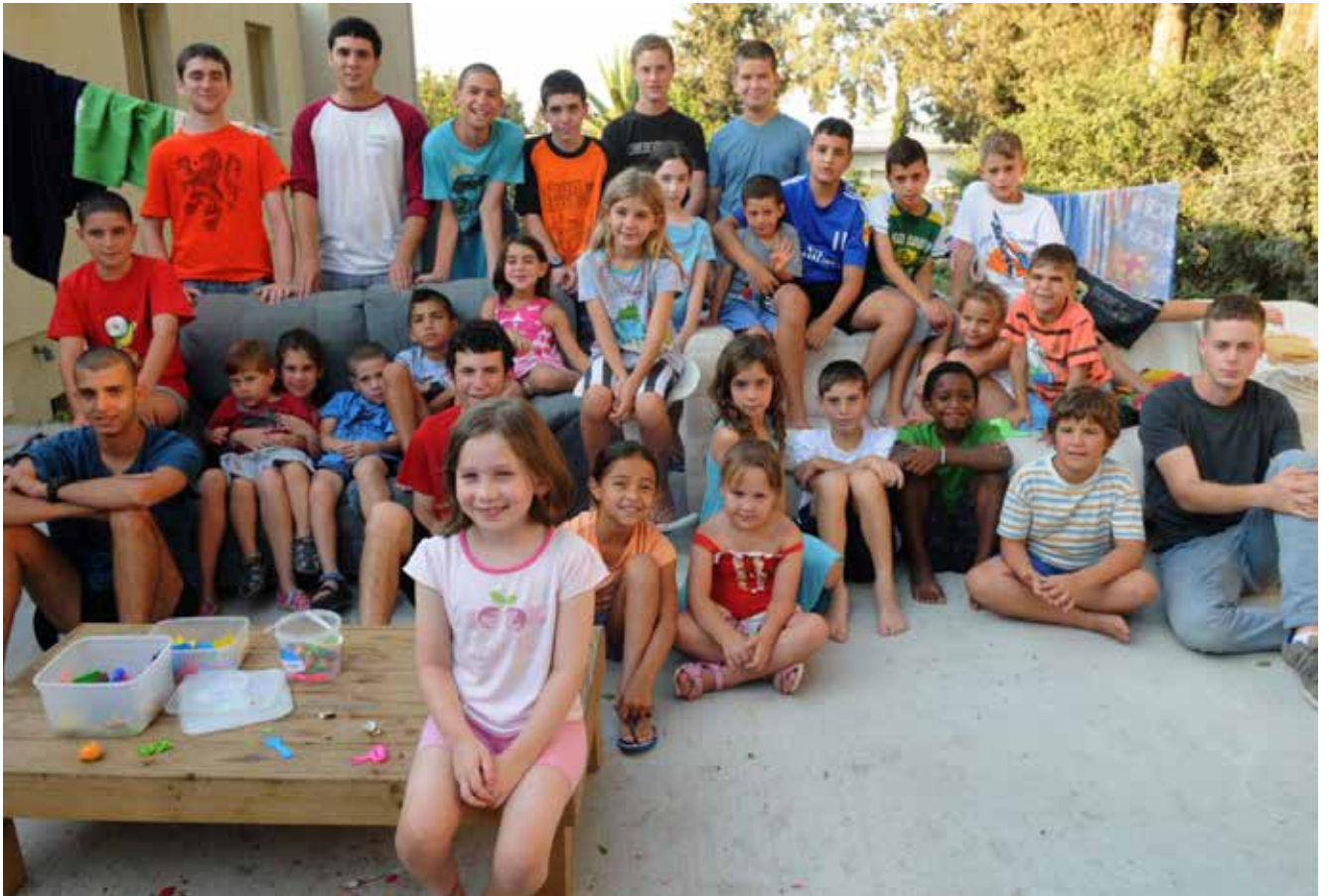
ילדים שפוגו מקיבוץ נירים במהלך מבצע "צוק איתן" מתארחים בקיבוץ משמר-העמק | מהניסיון שנצבר בעולם עולה שהיעילות בהתפנות תושבים ממרחב מותנית בהכנה מוקדמת ובתכנון, ברמת הניהול של הביצוע ובמקורות הכספיים המוקצים לכך מטעם השלטונות

שיעור גדול יותר ממשאביה לנושאי הפיתוח החשובים העשויים להיטיב את חיי תושביה במרחבים הנידונים. דומה שהשלום העתידי יהיה בין המדינה היהודית הדמוקרטית לבין רצועת עזה המפורזת במסגרת המדינה הפלסטינית.