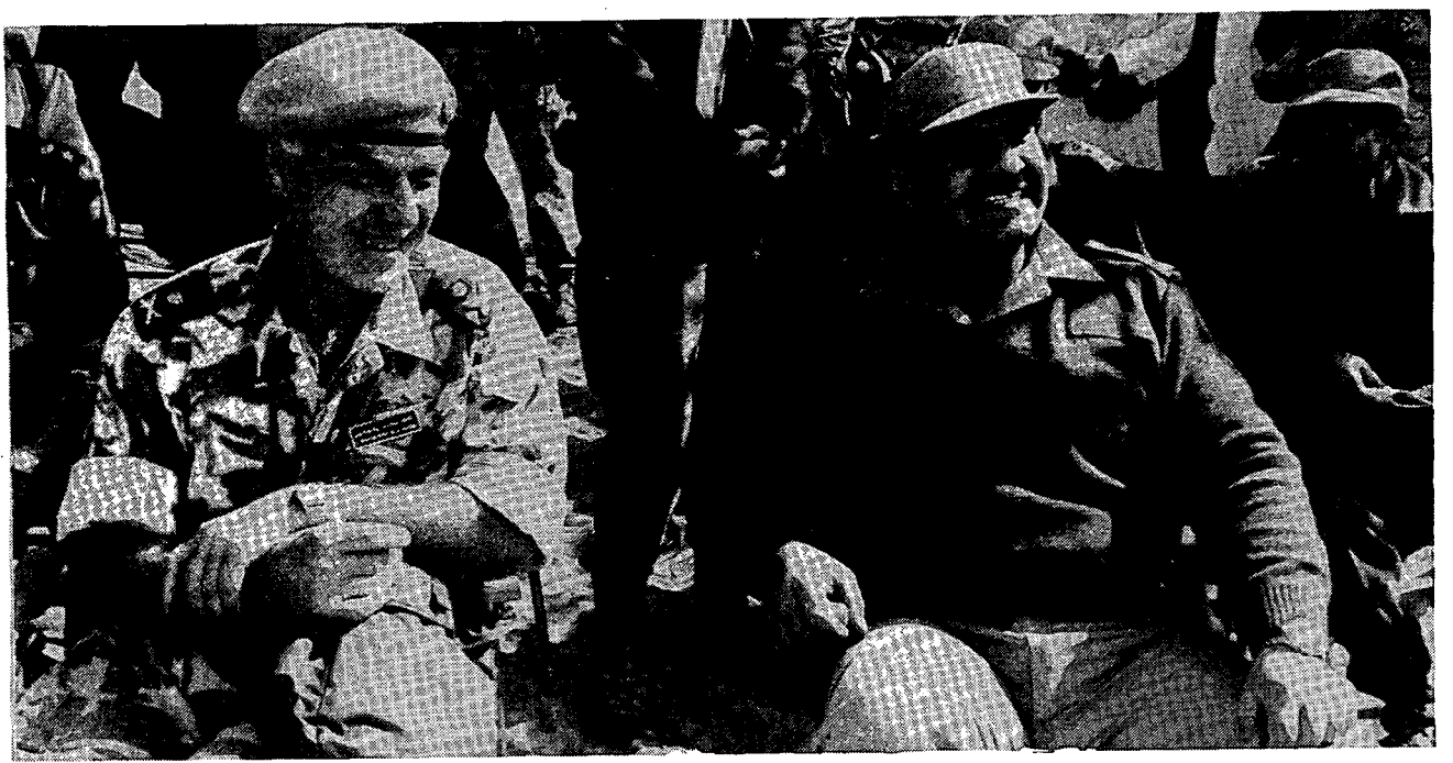
המחבר (משמאל) עם הנסיך גנרל חאלד בן סולט, מפקד הכוח הסעודי במלחמת המפרץ

1. את היחידה ייסד בשנת 1941, במהלך מלחמת העולם השנייה, דיוויד סטירלינג. היא פעלה, בעיקר, במדבר המערבי נגד הכוחות הגרמניים. גם לאחר שנפל סטירלינג בשבי הגרמנים המשיכה SAS לפעול עד תום המלחמה. לאחר מלחמת העולם אורגנה SAS מחדש, בעיקר, כדי לעסוק בדיכוי התקוממויות ברחבי האימפריה הבריטית ובלוחמה נגד טרור ונגד גרילה עירונית, אך השתתפה גם בפעולות קרביות – כמו המערכה בפולקלנד. 2. כריס – קומודור כריסטופר קריג, מפקד הכוחות הימיים הבריטיים במזרח התיכון (SNOME). פדי היין – מרשל האוויר פטריק היין, מפקד שותף של כוחות הקואליציה ומפקדו הישיר של גנרל דה לה בלייה. לויטננט ג'נרל צ'ארלס הורנר, מפקד כוחות האוויר של בעלות הברית.