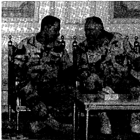
גנרל נורמן שווארצקופף (מימין) עם גנרל קולין פאוול, י"ד המטות המשולבים של ארצות הברית

הלוחמים חשבו, כי מדובר בטנק, או בשריונית, חגרו את כל ציודם, ודרכו את משגרי הטילים שלהם. התברר, כי זה דחפור, שנע כשסבינו מורמת – אחד המקומיים ערך סיר משוריין. מפקד הסיר החליט, כי אין מה