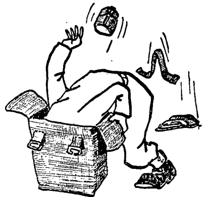
יש לבדוק מדי פעם את התרמילים

תוך כדי חלוקת ציוד לפרט התגלה מחסור במספר פריטים שהיו צריכים להיות בתרמיל הגדול, כגון: מימיה, נושא-מימיה, שכמיה, רשת הסואה, וכו'. ונשאלת השאלה כיצד אפשר לחסל את הדבר. זמנו של האפסנאי הפלוגתי, המקבל את המחסן ה"פלוגתי, מצומצם מאוד מאוד, ואין באפשרותו לבדוק כל תרמיל, ולעמוד על הפריטים החסרים בו. הצעתי היא, כי אגף האפסנאות יבדוק את הדברים מדי פעם בפעם (כדוגמת ביקורת תקופתית על איחסון הנשק ביחידה). בביקורת כזו יש לבדוק את התרמיל, אם מכיל הוא את כל הפריטים, ואם אין צורך בהשלמות ובהחלפות שונות. ביקורת זו חייבת, לדעתי, לודא לא רק שהאיחסון והתחזוקה הם בסדר, אלא גם ש"החייל יקבל עם התייצבותו חגור וציוד תקינים ו"