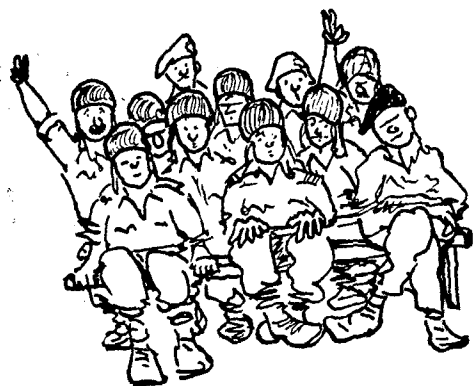
רק שניים הצביעו...

כמובן, בכל הרכב של בית-דין צבאי מחוזי מן ההכרח שכאב בית-דין ישמש שופט מקצועי ואף את זאת יש לקבוע מפורשות בחוק.