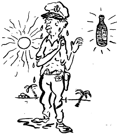
„קצינינו בעלי כושר שליטה...“

אצלם נוצר מעמד הקצינים לפני דורות רבים ע"י האצולה, אשר הטביעה בקצונה שלהם את השקפות-היסוד שלה לגבי חלוקת המין האנושי ל-מעמדות עליונים ותחתונים, בלויית כל ה"מוסר" האופייני שהיה מיוחד להשקפות אלה, אך גם הבריטים נאלצים להכנע יותר ויותר להשפעת "הזמנים החדשים" בהתפתחות החברה האנושית ו-השינויים שחלים במחשבה הצבאית בזמננו. גם אצלם ניכרים כיום סימנים של התאמת הדברים לרוח הזמן, אולם אנו, שמסורת זו זרה לנו לחלוטין, מה כי נסתבך בהשאלת "ערכיה" המפוקפקים-למדי, לנו מסורת עתיקת-יומין, המעלה, כערך, את כבוד האדם באשר הנהו אדם, ובצלם אלוהים נברא.