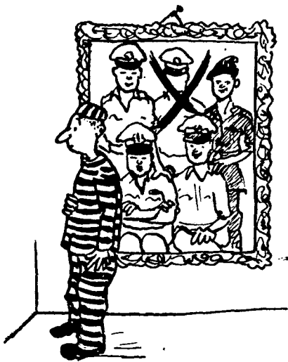
„אין מקום במשפחת הקצינים...“

במשפחת המפקדים בצה"ל ויש לפלוט אותו מתוכה ע"י הורדתו לדרגת טוראי.