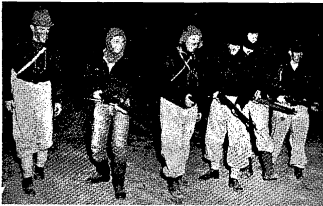
יחידת גריליה, מורכבת מקציר נים וחילים תושבי העיר קייפ טאון — בשעת אמן.

המשרתים, כגון חיל-הנדסה, קשר, חימוש, אס-פקה ועוד, בהתאם למגמות החדשות — וכן במערכת יחידות-ה"קומנדו", אשר לה נודעת בדרום-אפריקה מאז (ועוד יותר — במסיבות החדשות) חשיבות ראשונה-במעלה. שכן יחידות אלו (המכונות גם "התאגדויות-קלעים") מקיפות את כל האזרחים ה"אירופאיים", בגיל מ-17 ועד 45 שנה, בעלי הכושר-הגופני המתאים. הן מתאמנות ביריה ובתרגול טקטי בסיסי. חובת-האימון חלה על כל אותם בני 17—25 שאינם נמנים על "כוח-האזרחים הפעיל", הקולט רק כ-50% מביין אנשי השנתונים — ועיקר-אי-מונם מתחלק כרגיל על פני 4 שנים. יחידות-ה"קומנדו" עשויות להקרא-אל-הנשק בכל רגע של צורך. כמובן, שעיקר תכליתו של כוח זה, אשר לפי מספרי האוכלוסיה הלבנה עשוי למנות למעלה מ-200 אלף איש (אם כי במסגרת היחידות המתאמנות כלולות בכל שנה נתונה רק רבבות אחדות) היא ה"שמירה על השקט הפנימי", הן במקרה של מהומות בערים ובעיירות והן במצבי תסיסה באזורים כפריים. כל "קו-מנדו" הוא מעין גדוד, המונה (לפי החבלים השונים) מ-500 ועד 1000 איש, הכל לפי חלוקת האוכלוסיה הלבנה וצפיפותה באותו אזור-מקומי מסוים. יחידות אלו מתחברות ל"קבר-צות-קומנדו", מעין בריגדות נפתיות, הנקראות מעתה על שם אישים דגולים של העבר הדרום-אפריקאי ומנהיגים צבאיים (בעיקר — על שם מפקדי ה"בורים", במלחמות שנלחמו בשעתם נגד הבריטים). השלב השני, שבביצועו הוחל עתה, חל על עיקר כוחה הצבאי של דרום-אפריקה: "כוח-האזרחים הפעיל", שמנה 52 רגי-