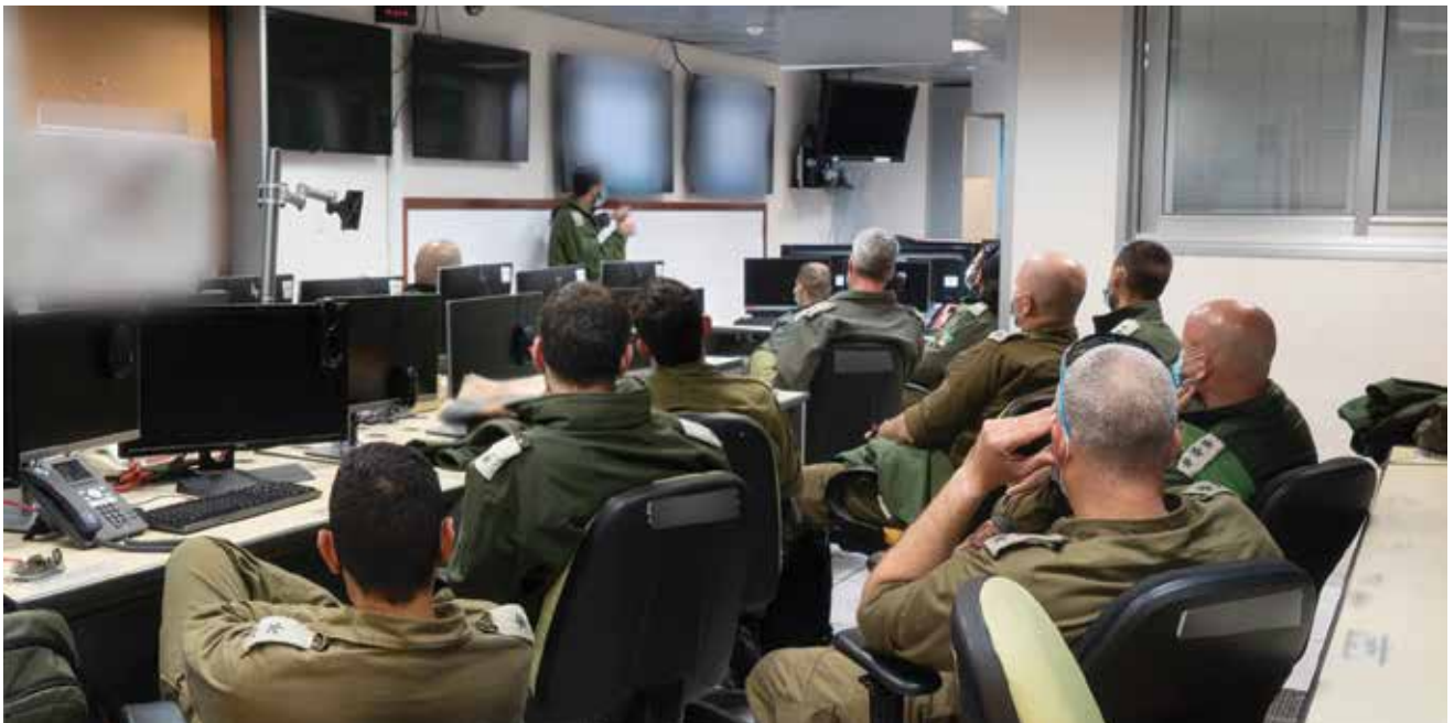
הצגת תוכנית בפקוד הצפון, מרס 2021. המפקד פועל לא פעם בסביבה של מתח וניגוד בין עקרונות, כללים והגיונות פעולה

הטכנולוגיה הופכת את תפקיד המפקד לדואלי, באופן שבו היא גורמת לו לפעול בד בבד בשני "עולמות מקבילים". באחד מהם הוא המרכז, ומשמש כמקבל ההחלטות וכמעבב המציאות; ובאחר הוא חלק מרשת שלמה, שלא פעם דוחקת אותו לעמדת השפעה משנית. על המפקד להרכיב לעצמו סל מאפיינים ופרקטיקות שיאפשרו לו הסתגלות מהירה והתארגנות מיטבית