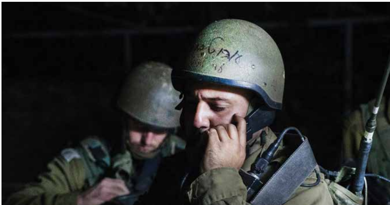
חמ"ל בנימין, פברואר 2016. הסתמכות על האמצעים הטכנולוגיים כאסטרטגיית התמודדות היא יעילה, אולם אינה מעניקה פתרון מלא לתנאי האי־ודאות השוררים בקרב

ובגדוד תפקיד מהותי יותר מבעבר בתהליכי הפעלת הכוח, בשל יכולתם הגדלה להביא מידע שמשפיע באופן ישיר על פעולת הכוח הלוחם.