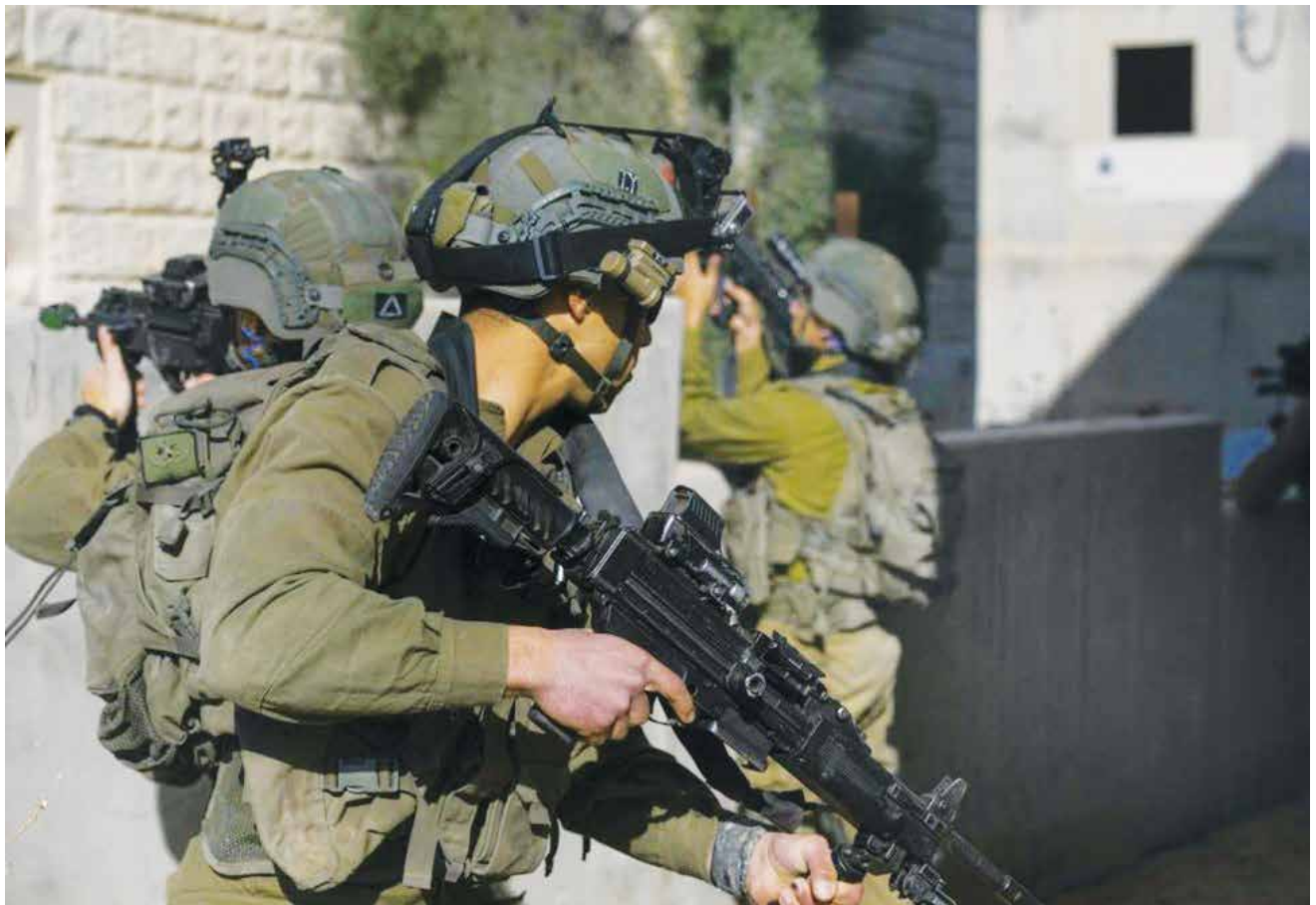
השתלמות "קפיץ דרוך" במל"י, מרס 2021. "הרכבי הכוחות ברמת הפלוגה יצטרכו להיות הרבה יותר גמישים - ייתן ויקבל, ייתן ויקבל, ייתן ויקבל."

שלעיתים יכולים להתנגש. באחד מהם הוא המרכז, מוקד ההשפעה העיקרי, ומשמש כמקבל ההחלטות וכמעצב המציאות; ובאחר הוא חלק מרשת שלמה, שלא פעם דוחקת אותו לעמדת השפעה משנית.