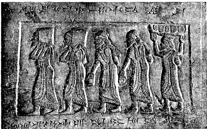
שליחי יהוא נושאים חס לשלמנאסר ב'

נגד מבצעי המדיניות האשורית במלכות ישראל עצמה, ניתן בשנת 734 ע"י מהפכת-הצר שבה קיפח את חייו פקחיהו בן מנחם בידי שלישו, פקח בן רמליהו. עם עלותו של המלך החדש על כסא המלכות שונתה מדיניות-החוץ של המדינה הישראלית בתכלית. במקום מדיניות הפיוס של מנחם כלפי אשור באה עתה אוריאנטציה חדשה כלפי ארם-דמשק, במטרה להקים ברית מוצקה, ביחד עם עוד כמה מדינות שכנות, נגד תגלת פלאסר (2) . ואולם הפעם היה החשבון מוטעה מלכתחילה, כי בעלי הברית איחרו את השעה ההיסטורית, שבה יכלו עוד אולי לעמוד בחזית משותפת בפני המשחית האשורי.