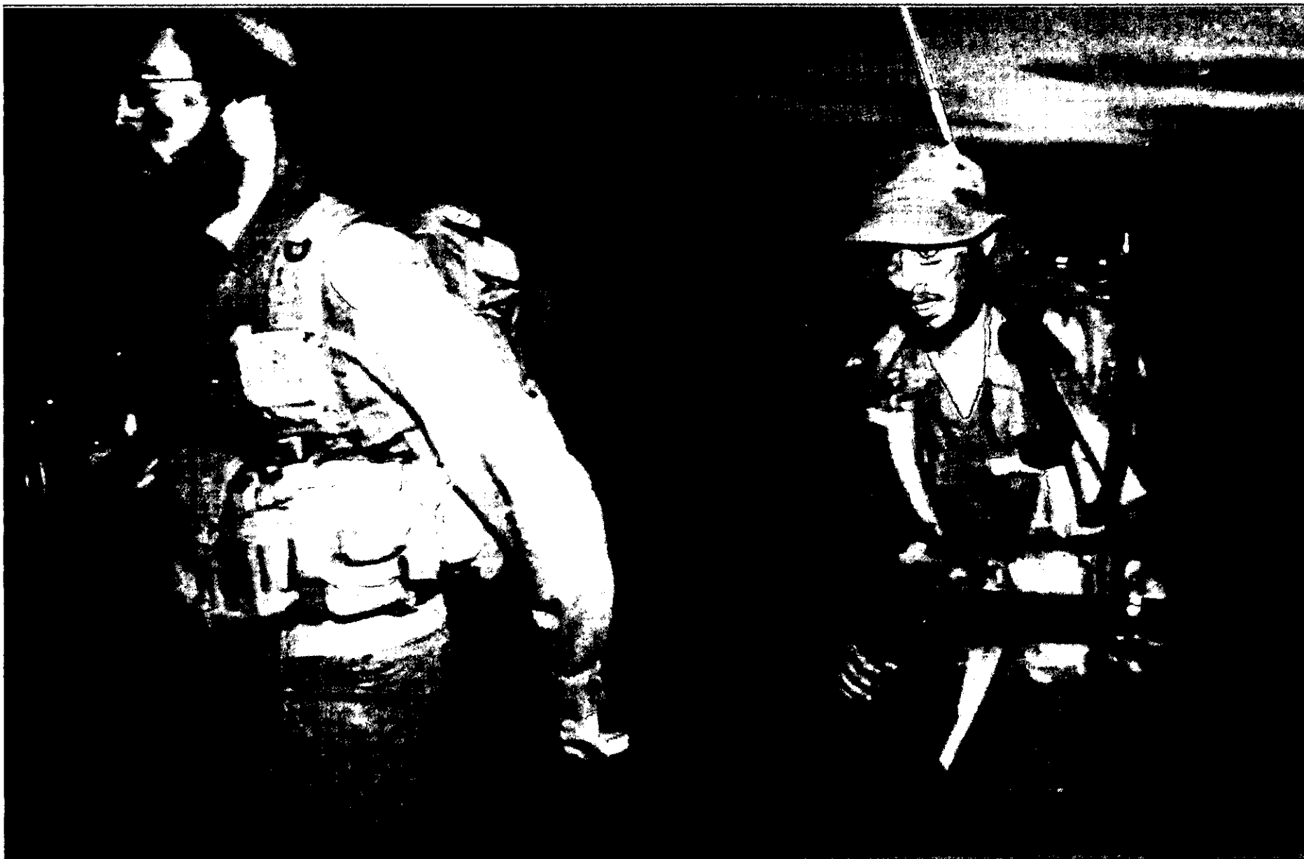
המשותף למרבית המתגייסים מ"הכיפות הסרוגות" הוא מוטיווציה גבוהה בשילוב עם הפנמת דרכו "הצבאית" של הצבא. לכן, ככלל, לא נמצא את נציגי הקבוצה הזאת בין הסרבנים

אומנם ישנם צעירים מבין לוחמי "הכיפות הסרוגות", המתלבטים בסוגיות מוסריות הלכתיות, כפי שכהן מדווח, אך המסקנה מביאה אותם (אם בכלל) לשינוי התנהגות במסגרת הפרדיגמה הצבאית, בדומה לדפוס ההתמרקות של "שיח לוחמים" בשעתו, ולא לפעולה