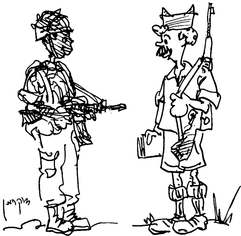
הקבוצות שמחוץ לליבה החברתית מבקשות בצורות שונות לקרוא תיגר על דמות הלוחם-גבר האשכנזי-חילוני (ה"צבר" על גלגוליו), שהצבא זוהה עימה מאז היווסדו

אחרות. מכך נגזר מערך האינטרסים של הקבוצות, וזה מזין את השקפת עולמן האידיאולוגית בנוגע לשימוש בכוח ואת המוטיווציה שלהן להקריב כדי לממש את האידיאולוגיה הזאת, בראש ובראשונה כלוחמים בכוח ובפועל וכמשלמי מיסים. אין במהלכי ההנהגה הפוליטית של הממסד הצבאי כדי להסביר לבדם את הנכונות להקרבה, שכן מהלכים כאלה אינם יכולים להתקיים בלי התמיכה המעשית ביותר מצד אלה שאמורים להקריב כדי לממש את המהלכים. לכן נדרשת התחקות אחר הזיקה בין מהלכים מדיניים-צבאיים ספציפיים לבין המידה שבה המהלכים האלה שירתו את האינטרסים של קבוצות קובעות באופן שהניע אותן לתמוך במהלכים או להתנגד להם. התחקות אחר דינמיקה כזאת אינה מלאכתו של בלש (כלהגו/לעגו של כהן), אלא היא מלאכה המתמקדת בחקר מבנים חברתיים-פוליטיים ובמנגנוני השתנותם.