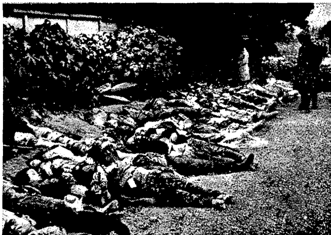
קרבות הפצצת טוקיו (מרס, 1945) מוצגים לזיהוי באחד הפארקים של העיר

הטיפול הרפואי, התחבורה, חלוקת המזון וגיוס כוח-האדם — תוספנה גם בעתיד להוות את עמודי-התווך של כל המאמץ המלחמתי כולו. ומה שנעשה בשטחים אלה במלחמת-העולם — ביחוד בארצות כאנגליה או גרמניה — יכול לשמש חומר חשוב מאוד למתכננים הישראליים שיסייע להם הרבה בהכנותיהם.