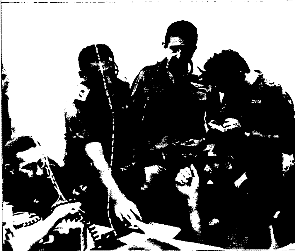
היוצרות התהפכו: אם לפני מלחמת יום הכיפורים היו אלה המתריעים בשער שנדרשו להפגין אומץ לב הערכתית, דומה כי היום נתבעת תכונה זו דווקא מצד צופי ההזדמנויות

כי היום נתבעת תכונה זו דווקא מצד צופי ההזדמנויות. אין מדובר כאן רק בדיון אקדמי. להפרזה שיטתית בכוחו וברוחו של היריב יש פוטנציאל חמור לגרימת נזק. הגזמה עלולה להקנות למודיעין תדמית של גוף מחולל פאניקה, בלתי מקצועי ואולי אף מפוחד. אנשי מודיעין אינם ששים להודות במסקנה זו, ולעולם יטענו כי אם כבר נגזר עליהם לטעות, יעדיפו תמיד לשגות לצד החומרה. כאשר הם מוצאים את עצמם מתמודדים עם הערכות הנוגדות את אזהרותיהם, יתריסו אותם חוקרים כי אלה משקפות משאלות לב, ולפיכך הן