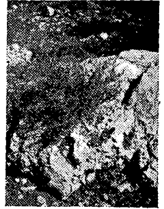
סירה בין סלעים

אנו עולים למדרון שמ- מול. מרבית השטח מכוסה בשיחים קוצניים אפורים או ירוקים-אפורים, בעלי צורה כרית-עגלגלה. פירור תיהם הקטנים נתונים בתוך גביעים קטנים נפוחים- אדומים, המזכירים בצורתם סירי-חרס ערביים. על שום כך נקרא במקרא השיח בשם „סירים“, ובלשון