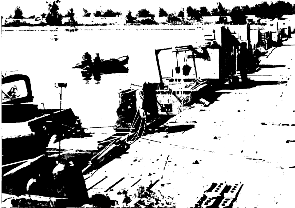
הנשיא סאדאת, כהוגה רעיון המלחמה המצרי ב-1973, הצליח ביציאתו למתקפה לא רק לממש את המשימה הטקטית - צליחת תעלת סואץ - אלא גם לחולל מגמה אסטרטגית: מאמץ מדיני להשבת סיני לידי המצרים

הקורא בדעת הקהל בישראל "תנו לצה"ל לנצח" מצפה בערגה למעין "מבצע חילוץ", לפעולת "סופר-מן" שיהיה לה, כמו בסרטי מערבונים, התחלה, אמצע וסוף טוב.