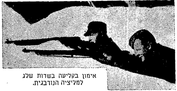
אימון בקליעה בשדות שלג למליציה הנורבגית.