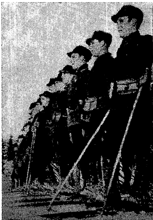
יחידת קלעים-מגלשנים של המליציה הנורבגית.

בת שנתיים, קצינים מקצועיים לחיל-היבשה ולצי-המלחמה. כן היה קיים בית-ספר-גבוה לקציני חיל-היבשה — „אקדמית-המלחמה“.