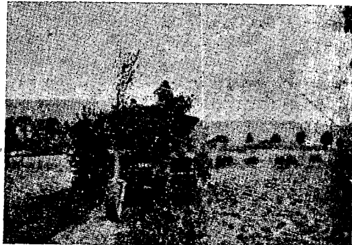
בהתקדמות אל רכס „יער טבטנברג“ טנק „צנטוריון“ בריטי מוסוה בעלנה.

בגזרה המזרחית, מסתמנים עתה שני איומים. האחד — כלפי האגף המערבי (ורובו — טנקים) — מגיע עד להרסאָ וינקל, בחבל ארץ המבותר על-ידי נחלים, „ארץ הדרום“ משגרת לשם יחידות מדיביזיות השריון ה-16, שנמצאו בעתודה בקרבת וידנבריק. האיום השני הוא במזרח: כוח צפוני (ברובו חיל-רגלים) חודר לתוך מערך הבריגדה הבלגית ה-4 ומבקיעו. הוא נמצא עתה, באופן ברור למדי, באגפם של הכוחות המגינים. תגבורת דרומית נמצאת בתנועה לעבר אזור זה. במרכז, נהווה קו מצפון ומצפון-מזרח לגיוטרסלו,