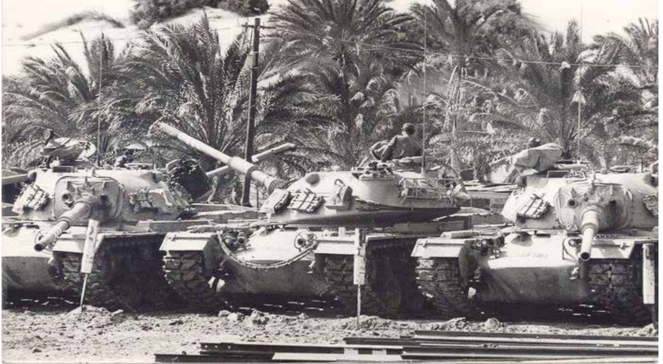
טנקי גדוד 9, חטיבה 14 בנווה המדבר קטיה לפני המלחמה. פקודת "שובך יונים הופעלה חלקית, וללא קידום גדוד 9 לקו המעוזים, ופחות מכשעה לתחילת ההרעשה המצרית ששולבה עם הצליחה.

מדובר בעיקר בגדוד 68, שהורכב הן מכוחות סדירים והן מכוחות מילואים. ההיכרות בין הלוחמים הייתה מועטה והם לא הספיקו לתרגל יחד את מהלך הפקודות. 11 נוי מציין כי כבר בספטמבר הוא ביקש לתרגל את פקודת "שובך יונים" באופן מלא, על גבי זחלים, אך בקשתו נדחתה. נקבע שהדבר יבוצע לאחר חילוף של גדוד 9 בגדוד 195, אך המלחמה פרצה קודם לכן. 12