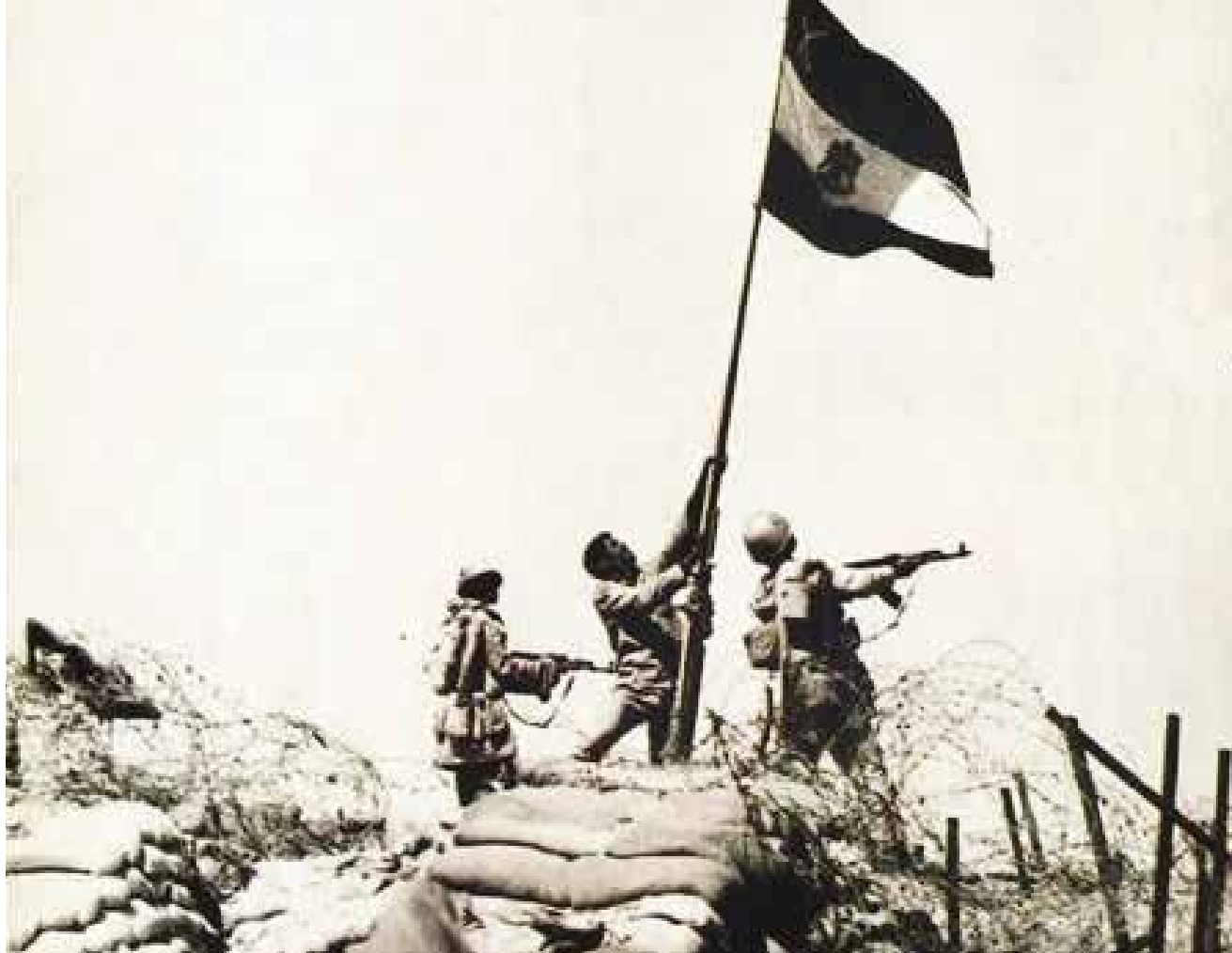
חיילים מצריים מניפים את דגל מצריים בקו בר לב. לחימת גדוד 9 הפכה מניהול קרב בלימה והגנה נגד צליחה לקרבות חילוץ מול מארבי נ"ט, לאחר צליחה בפועל.

הלילית שניהלו. בליל 8/7 באוקטובר הגיעה לאזור אוגדת מילואים 162 (מפה 2). בבוקר 8 באוקטובר פתחה האוגדה בהתקפה על ראשי הגשר של הארמייה המצרית השנייה במטרה לפרוץ את הקו המרכזי שלאחר הצליחה, אך ההתקפה נכשלה, ואחריה החל שלב הגנה בחזית סיני.