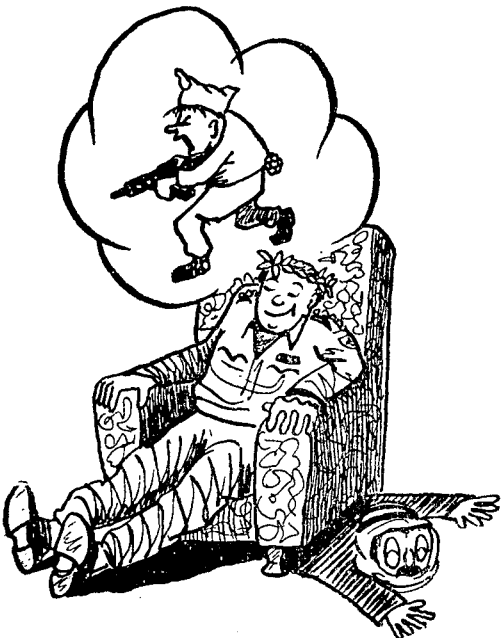
מתרפק על זכרונות העבר...

כל עוד לא הוקם בית-ספר גבוה יותר, חייב פו"מ להכשיר את מפקדי העוצבות שבעתיד. דבר זה הרי מוגדר במטרתו —