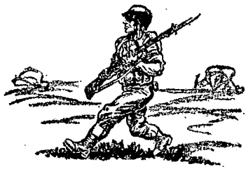
החיל הרגלי — לא יהיה "חמור-משא" עמוס-לעייפה".

אמצעי-קרב חדשים כפעולה מוגברת של כלי-נשק מחייבים שינויים בטקטיקה. אין לך צורת קרב המחייבת שינויים כה רציניים באורה הלחימה כמו ההתקפה. נסיון המלחמה מלמד כי פרט לראדאר ונפלים — לא נתגלו אמצעי-לחימה שיש בהם כדי