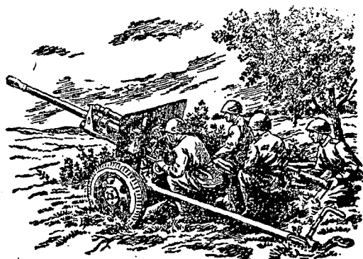
תוחת שדה ונ"ס רוסי 7,62 ס"מ

אשר כמותם כחיסולן. רק ב-1943: שונה מצב-דברים זה. אולם רישומו המעשי של השינוי לגבי הגייסות בא מאוחר מדי. במהלך המלחמה נתדלדל מקור התחלופת כל כך, עד שבגלל האבידות הרבות בחזית, לא נותרה אפשרות להתאמנות מספקת ואף לא למתן השלמות מספיקות לעוצבות שבשדה. בגדודי מילואי-התחלופת הרגליים, למשל, היה ה"רובאי הפרט מתאמן לקראת הצטרפותו לפלוגה ר"באית במשך ששה שבועות בלבד, ומאלה נועדו שבועיים להכנות ליציאה לחזית. עקב כך ירדה במידה מבהילה רמת האימון של המילואים שהגיעו לחזית וכתוצאה ישירה מכך ירדה גם רמתן של עוצבות הרגלים בכללן. בגלל האבידות הרבות היו מילואי תחלופת אלה נשארים, תוך שבועות אחדים