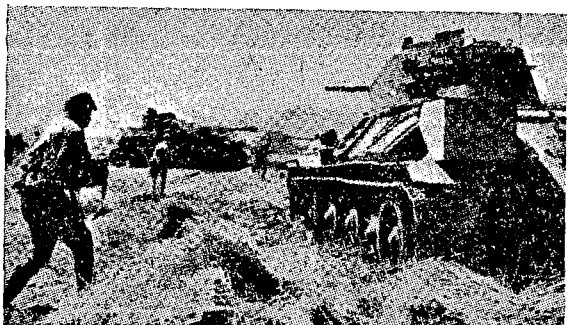
משנתקלו בטנק הרוסי T 34 נדונו לכשלון התקפות-הנגד של הרגלים הגרמנים.

פתיחת ההתקפה זריזה ותכליתית כאשר תהיה — הרי היכולת להסתגל, במהלך ההתקפה, לנתונים בלתי-צפויים, תהיה ודאי גם בעתיד מוגבלת ע"י הגורמים הבאים: