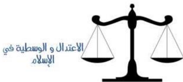
איור 2: האיזון והווסטיה באסלאם

מקור ההשראה הקראא'ני לווסטיה הוא פסוק 143 בסורת אל־בַּקְרָה, 2: "כך עשינו אתכם אומה מן המיטב (אֵמָה וְסֵט) [או עדה שהולכת בדרך האמצע], למען תעידו על מעשי האנשים ולמען יעיד השליח על מעשיכם". פסוק זה מציין את ה"וְסֵט" כתכונה של האומה המוסלמית, ופרשני הקראא'ן העניקו לה פירושים שונים שבמידה רבה השפיעו על בחירת השם לזרם הרעיוני של קרצ'אוי. לפי הפרשנים, תיאר אלה את האומה המוסלמית כאומת אמצע בין הנוצרים ליהודים, שכן הדבר האהוב ביותר על אלה הוא האמצע. 40