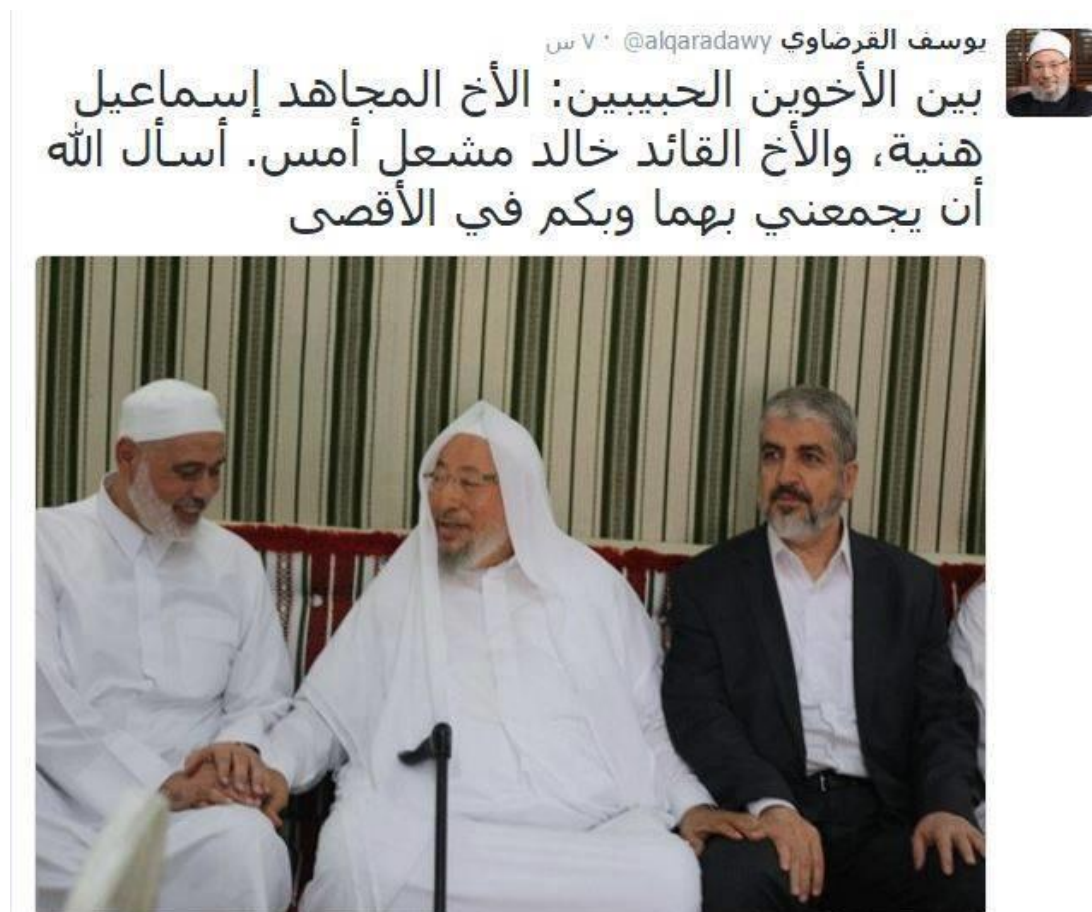
איור 1: "בין שני האחים האהובים: האח לוחם הג'האד, אסמאעיל הניה, והאח המפקד, ח'אלד משעל, אתמול. מבקש מאללה שיפגיש אותי עם שניהם ועמכם באל־אֶקְצָא"

ב־26 בספטמבר 2022 מת בקטר שיח' עבד אלה יוסף אל־קרצ'אוי, גדול אנשי הדת והפוסקים המוסלמים הסונים בימינו. בהודעות על מותו אפשר לזהות כי דמותו, כמו גם פסיקותיו ומשנתו הרעיונית, נתונות במחלוקת בעולם המוסלמי: מצד אחד בלטו ראשי חמאס הן בהודעות אבל שפרסמו אחר מותו ובמתן הספדים, והן בהשתתפות צמרת ההנהגה בלווייתו. ח'אלד משעל, הממונה על יחסי החוץ של חמאס, כינה את קרצ'אוי "מחדש הדור ומנהיג [זרם] הווסטיה". משעל החשיבו כאחד מבכירי "מקורות הסמכות (מִרְגְּעֵי־אֵת) הדתיים, השרעיים וההלכתיים של האומה" 1 . מנהיגי חמאס ובראשם אֶסְמַעִיל הַנִּיָּה, יו"ר הלשכה המדינית של חמאס, הדגישו את תרומתו המשמעותית של קרצ'אוי לסוגיית פלסטין. בהודעת האבל על מותו של קרצ'אוי הדגיש הניה כי קרצ'אוי: "בנפשו, במעשיו ובכספו אישר והדגיש כי תפקידם של אנשי הדת הוא להנהיג את האומה ולשאת באחריות השרעית כלפי פלסטין והתנגדותה. יתר על כן, הוא ביקר בפלסטין כפעיל רַבָּאט, (שבא להגן על פלסטין ולהיערך למלחמה למען שחרורה), כאמאם, שיח' ומלומד (עֲאֵלֵם) וכמי ששובר את המצור על עזה" 2 . הניה התכוון לביקורו של קרצ'אוי ברצועת עזה במאי 2013, כאשר נכנס אליה ממצרים דרך מעבר רפיח. בהספד קרא הניה לקיום תפילת אשכבה (מסוג צֵלָאֵת אל־ע'א'ב, כלומר בהיעדר המת) במסגד אל־אֶקְצָא. את המת כינה בשלל תארים: שיח' אל־אֶקְצָא, שיח' הסוגיה [הפלסטינית], שהיד ירושלים ושהיד האומה. 3