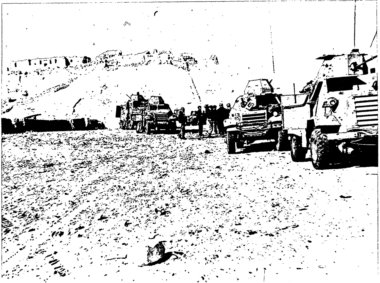
בדרך לסיני — כוחות צה"ל חולמים לפני ניצנה במבצע "חורב"

משר החוץ שרת), ללא קבלת הערכת מצב בדבר האפשרויות של הבריטים בפועל, וללא בדיקה בצינורות אחרים של הכוונות הבריטיות. הוא התייעץ עם ידן — בדבר אפשרות להמשיך את הפעולה נגד הרצועה, גם לאחר הנסיגה. משום שהורה כאשר הורה, עוד קודם לבואו של שגריר ארה"ב, בן-גוריון לא נצרך לשהות כדי להשיב לשגריר.