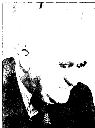
ראש הממשלה דוד בן-גוריון

בנישוחו האמריקניים נסבה על שאלת המפתח — האם ממשלת בריטניה תסתמך על החוזה משנת 1936. השגריר לא השיב ישירות. הוא דיבר על האינטרסים האסטרטגיים של ארה"ב ושל בריטניה באזור, וקבע שאסור לשתי הממשלות לתת למצב המאיים הנוכחי להימשך.