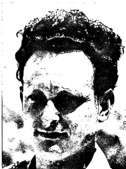
אלוף יואל אלון

בהמשך הודיעה ממשלת ארה"ב, "תוך דאגה חמורה וכראיה לידידותה העקיבה עם ישראל", על האפשרות שתיאלץ לעיין מחדש בבקשת ישראל להתקבל לאו"ם, ולדון ביחסיה עם ישראל — אם ממשלת ישראל יבצע את הפעולה בלתי מחושבת, תסכל את השלום במזרח התיכון. היא מזכירה, שהייתה הראשונה להכיר בממשלה הזמנית של ישראל ושימשה כשושבין לבקשת ישראל להתקבל לאו"ם, כמדינה שוחרת שלום. "נסיגה של כוחות ישראל מייד מטריטוריה מצרית נראה שהיא התנאי המזערי להוכחת כוונת השלום של ממשלת ישראל ולמניעת סכסוך נרחב