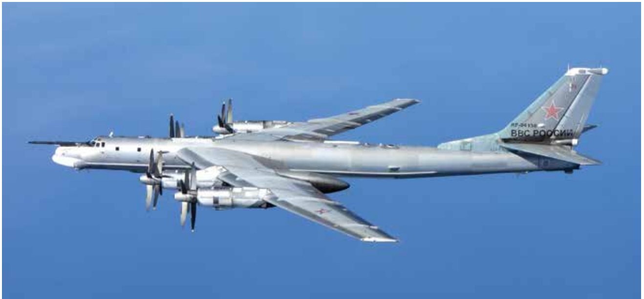
מטוס מדגם Tu-95 Bear. סיפק למפציצים ארוכי הטווח את היכולת לפגוע בנושאות המטוסים האמריקניות, תוך שהוא נשאר מחוץ לטווח היירוט

העצומים שעמדו לרשות הצי האמריקני, לצד פיתוחים טכנולוגיים ושילובן של טכניקות מבצעיות חדשות, הטו בסופו של מאבק קשה את כפות המאזניים לטובת בעלות הברית המערביות.