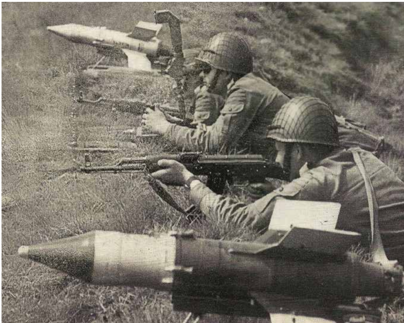
טיל מונחה, אנטי טנקי מסוג סאגר, שימש את מערך ההגנה המצרי בסני. סאדאת ידע כי צבאו לא יכול להתמודד מול היתרון של צה"ל בתמרון משוריין ובכוח אווירי

מטריית ההגנה של הנ"מ. 39 באמצעות מערכי הגנה אלה הצליח הצבא המצרי להדוף את התקפות הנגד המשורינות של צה"ל, ובמיוחד את זאת של 8 באוקטובר 1973.