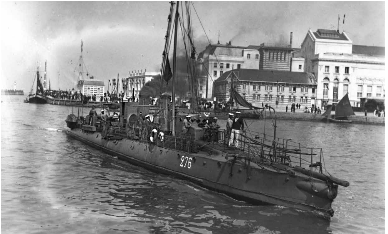
סירת טורפדו צרפתית מדגם 276, 1913. הספינות צוידו בכלים המאפשרים להסיר סגר ימי, ולנהל מבצעים התקפיים נגד חופי האויב הסמוכים ונגד צי הסוחר שלו

האסכולה הצעירה שנוצרה במחצית השנייה של המאה ה־19 והנדבכים שנוספו לה יוצרים תיאוריות אפשריות שלפיהן עשוי לפעול האויב. על צה"ל לגבש תיאוריה שלאורה ייערך תהליך בניין כוח, וביום פקודה - הפעלתו