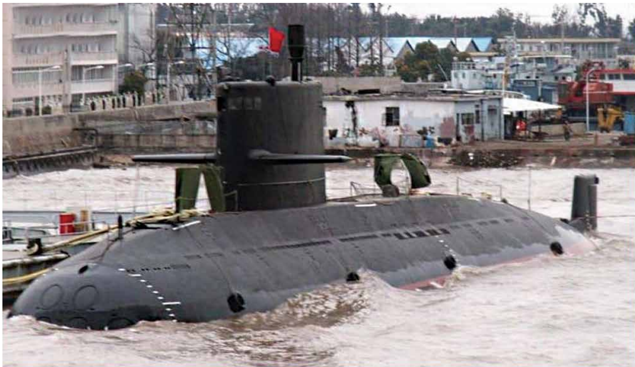
צוללת סינית מדגם A39 (יואן קלאס). ההרתעה נובעת מעצם העובדה שצוללות תקיפה בעלות הנעה גרעינית הפכו לנשק אסטרטגי

אחר דרכים למצוא את נקודות החולשה האמריקניות. לפיכך, מבחינתו של הצי הסיני, המודל שאותו יש ללמוד הוא המודל הסובייטי שהתפתח במהלך המלחמה הקרה, הן מבחינת בניין הכוח והן מבחינת תפיסת ההפעלה. על כוחותיה לפעול הרחק מתחומי ארצות־הברית בעזרת פלטפורמות המסוגלות לשגר אמצעי לחימה מלב ים, וכן תוך הסתמכות קריטית על נתבי התקשורת הימיים. מציאות זאת מגבירה את הרלוונטיות של החשיבה הסובייטית עבור הצי הסיני.