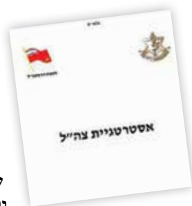
סמך אסטרטגיית צה"ל מסמך אסטרטגיית צה"ל עוסקים באופן בו המבנה והארגון של צה"ל יאפשרו לו לפעול בסביבה האסטרטגית

בעולם העסקים קיימת זיקה בין אסטרטגיה כשיטת התמודדות עם הסביבה, ובין אסטרטגיה כסגנון ניהולי