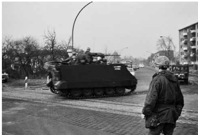
נגמ"ש אמריקני בברלין, 1970. יש שאף ביקרו את ההתרפקות של ארצות-הברית על תקופת המלחמה הקרה, בעשותה שימוש במושגים הקשורים לאסטרטגיה תחרותית

בהקשר זה יש לציין שגם כשמפקד הכוחות המיוחדים בצבא האמריקני, הגנרל ווטל, תיאר בתחילת שנת 2016 את "האזור האפור" המבטא לוחמה שלא בזמן מלחמה, 38 הוא התייחס במפורש לתחרויות בממדים השונים (צבאי, פוליטי, כלכלי וכדומה) בין ארצות-הברית ליריביה.